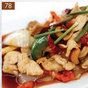
CHICKEN CASHEW NUTS