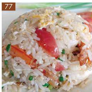
KHAO PAD KAI OR KHUNG

Thai fried rice with chicken or shrimp and vegetables