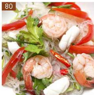
YAM WOON SEN TALAY

Glass noodle salad with shrimps, squid, lime juice and sauce dressing