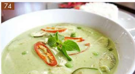
KANG KEAW WAN KAI

Green curry with chicken, served with jasmine rice