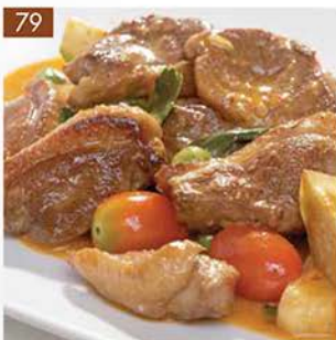
STIR FRIED DUCK BREAST RED CURRY SAUCE