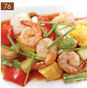
SWEET AND SOUR SHRIMP PINEAPPLE