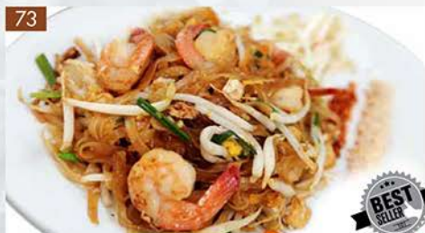
PAD THAI KAI OR KHUNG

Pan fried rice noodles with chicken or shrimp, tofu, green onions and egg