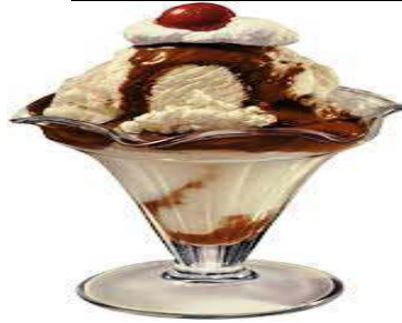
Ice Cream Sundae 100/-