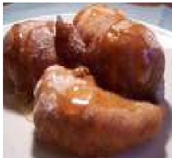
Banana Fritter With Honey 100/-