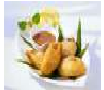
Pineapple Fritter With Honey 100/-