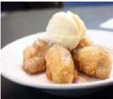
Banana Fritter With Ice Cream 150/-