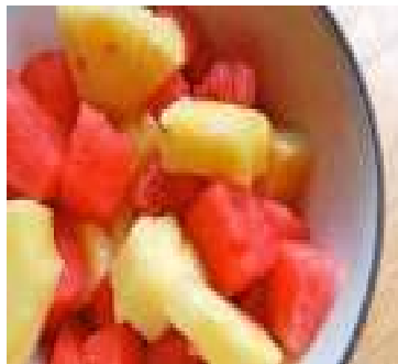
Mixed Fresh Fruits 100/-