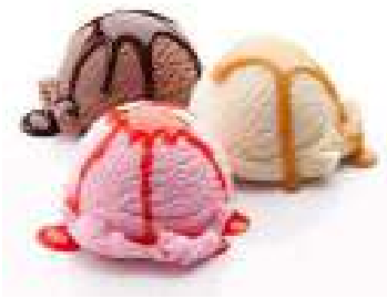
Ice Cream Any Flavor 100/-