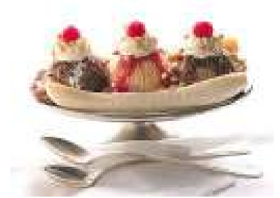
Banana Split 150/-