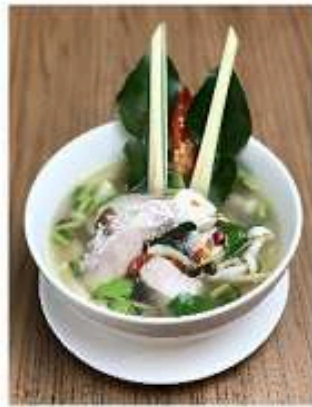
ต้มยำน้ำใสปลากระพง