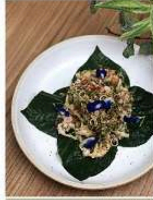
แซ่ร้งว่ากุ้ง