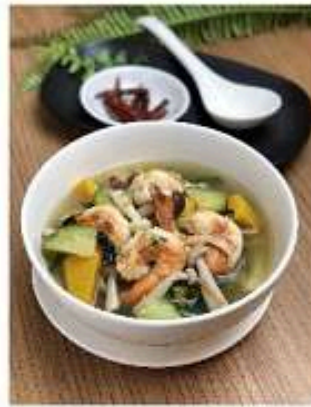
แกงเลียงกุ้ง