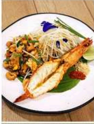
ผัดไทยเส้นมะละกอสด