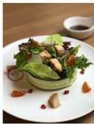
สลัดอกไก่นุ่มออร์แกนิก ซอสบัลซามิก