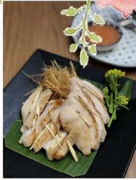
อวกโก่นุ่มออแกนิกย่างตะไคร้