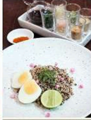
ยำควีนัวปีกษ์ใต้