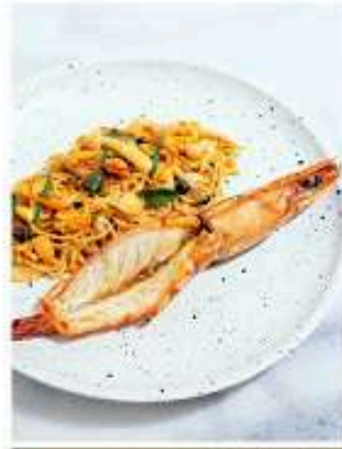
สปาเก็ตตี้ต้มยำกุ้ง