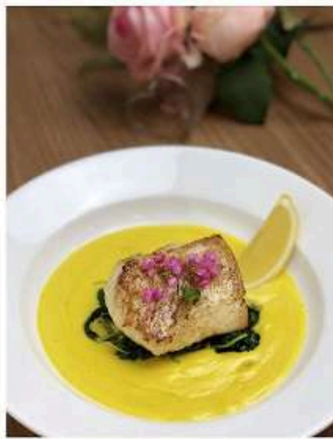
ปลาค็อดย่าง ครีมฟักทอง