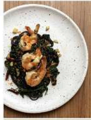
สปาเก็ตตี้หมึกดำผักโขมไข่กุ้ง