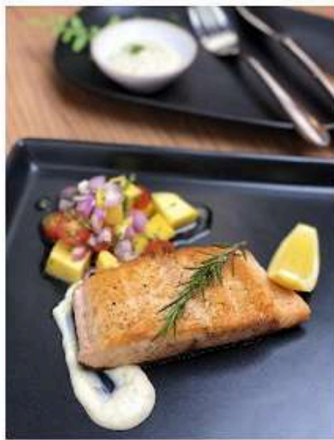
สเต็กปลาแซลมอน กับ ซัลซ่าอโวคาโดมะม่วงสลัด