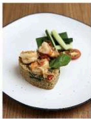
ข้าวกล้องผัดโรต๊ะพาหริกสดกุ้ง