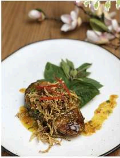
ปลาอินทรีสามรส