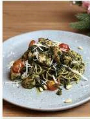
สปาเก็ตตี้ของทะเลได้