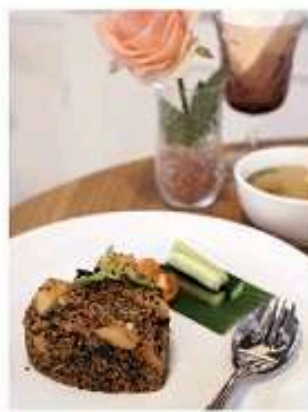
ควีนัวผัดกระเทียมไก่