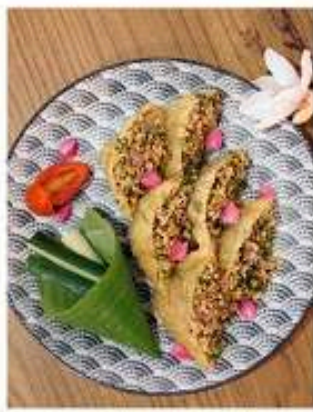
เต้าหู้ยัดไส้ลาบควินัว