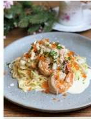
สปาเก็ตตี้ครีมไข่กุ้ง