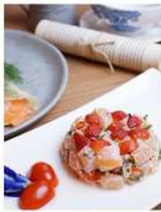
แซลม่อนอินเล็ฟ