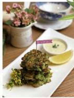
บรอกโคลี ฟริตเตอร์