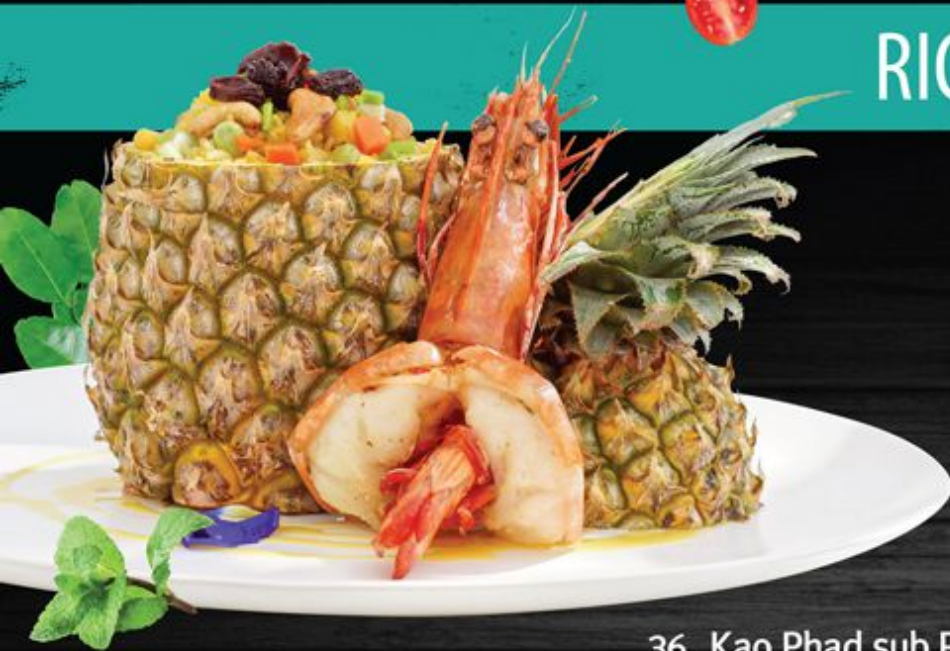
36. Kao Phad sub Pa rod 650.- (ข้าวผัดสับรด) (Fried rice with pineapple & grilled river prawns)