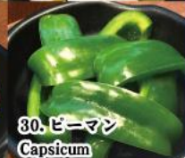
30. ピーマン Capsicum

GST 別途頂いております。サービス料は頂いておりません。PRICE ARE SUBJECT TO GOVERNMENT TAX, NO SERVICE CHARGE