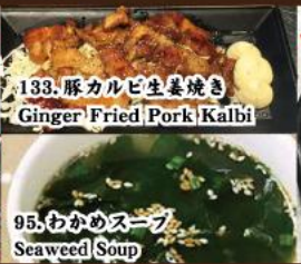
133. 豚カルビ生姜焼き Ginger Fried Pork Kalbi