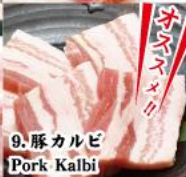
9. 豚カルビ Pork Kalbi