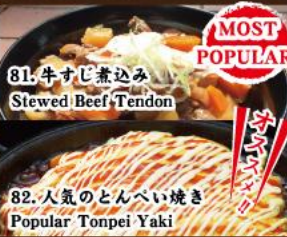
81. 牛すじ煮込み Stewed Beef Tendon