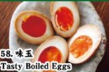
58. 味玉 Tasty Boiled Eggs