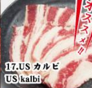
17. US カルビ US kalbi