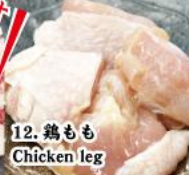
12. 鶏もも Chicken leg