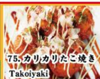
75. カリカリたこ焼き Takoyaki