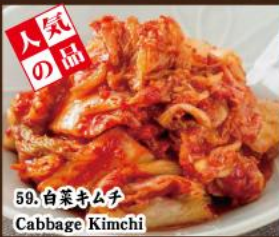
59. 白菜キムチ Cabbage Kimchi