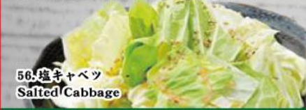
56. 塩キャベツ Salted Cabbage