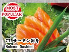
77. サーモン刺身 Salmon Sashimi