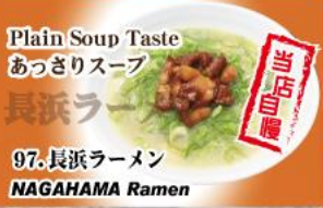
Plain Soup Taste あつさりスープ