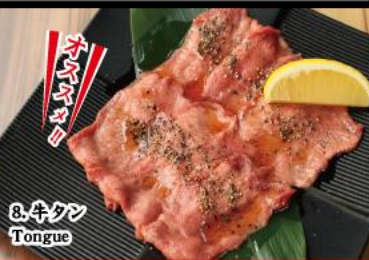
8. キタツ Tongue