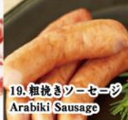
19. 粗挽きソーセージ Arabiki Sausage