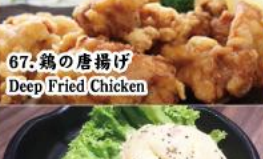
67. 鶏の唐揚げ Deep Fried Chicken