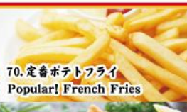
70. 定番ポテトフライ Popular! French Fries