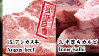
15. アンガス牛 Angus beef