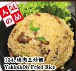
134. 焼肉王炒飯 YakinikOh Fried Rice