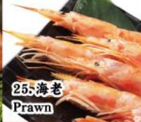
25. 海老 Prawn