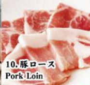
10. 豚ロース Pork Loin