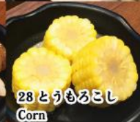
28. とうもろこし Corn