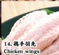
14. 鶏手羽先 Chicken wings