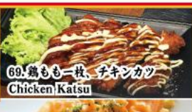
69. 鶏もも一枚、チキンカツ Chicken Katsu