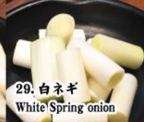
29. 白ネギ White Spring onion