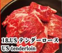
18. US テンダーロース US tenderloin