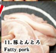
11. 豚とんとう Fatty pork