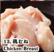
13. 鶏むね Chicken Breast