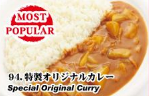
94. 特製オリジナルカレー Special Original Curry