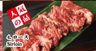
4. ロース Sirloin