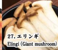
27. エリンギ Elingi (Giant mushroom)