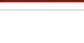
82. 人気のとんべい焼き Popular Tonpei Yaki