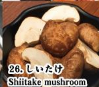
26. しいたけ Shiitake mushroom