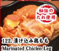
122. 漬け込み鶏もも Marinated Chicken Leg