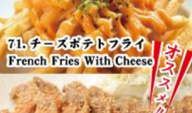
71. チーズポテトフライ French Fries With Cheese