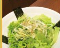
65. チョレギサラダ Choregi Salad