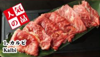
1. カルビ Kalbi