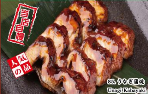
85. うなぎ蒲焼 Unagi Kabayaki