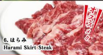
6. はらみ Harami Skirt Steak