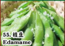
55. 枝豆 Edamame