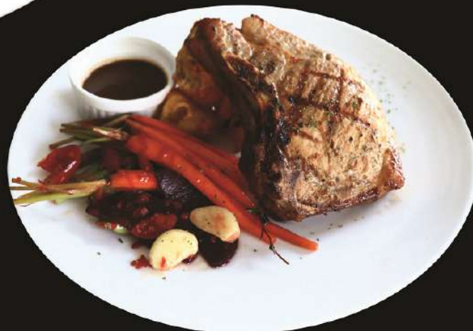
Pork Chops ポーク chops สเต็กหมูพออร์คชอป