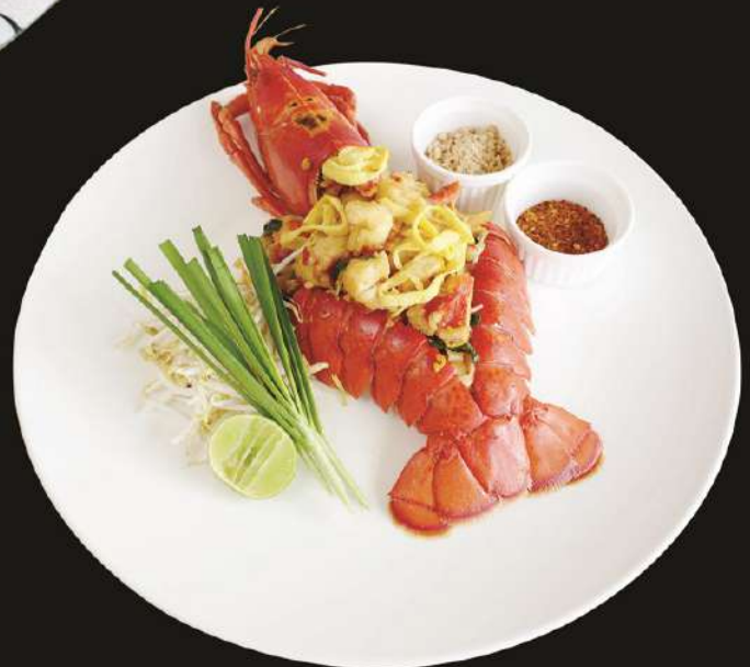
★ Pad Thai Lobster 1,190.- ロブスターパッタ ผัดไทยกุ้งลิ้นสือเตอร์