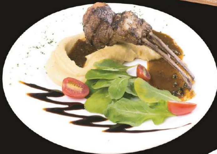
Lamb Rack ラムラック ซี่โครงแกะ