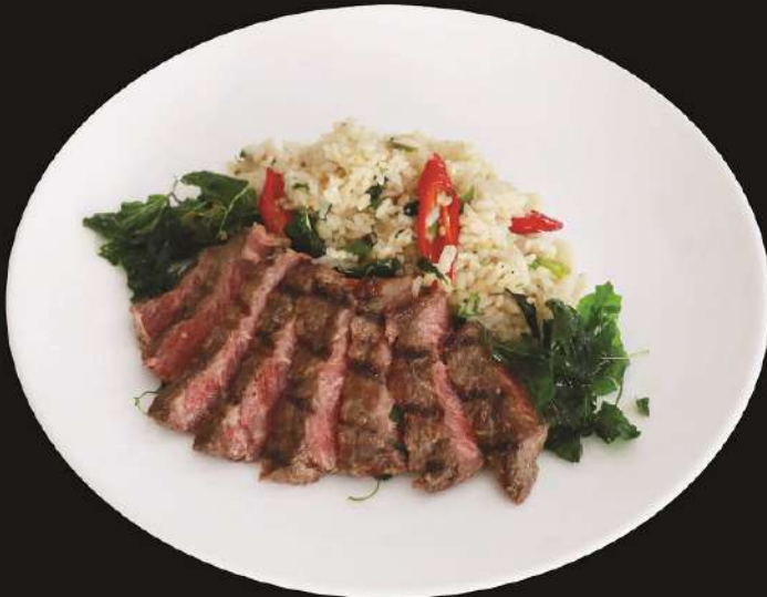
Rice Topped with Stir-Fried 390.- Wagyu & Basil ทライス/ไวย์ซีนี-和牛 ข้าวกะเพราเนื้อวากิว