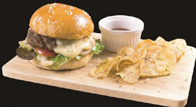
★ Wagyu Cheese Burger 390.- 和牛チーズバーガー เบอร์เกอร์วากิวชีส