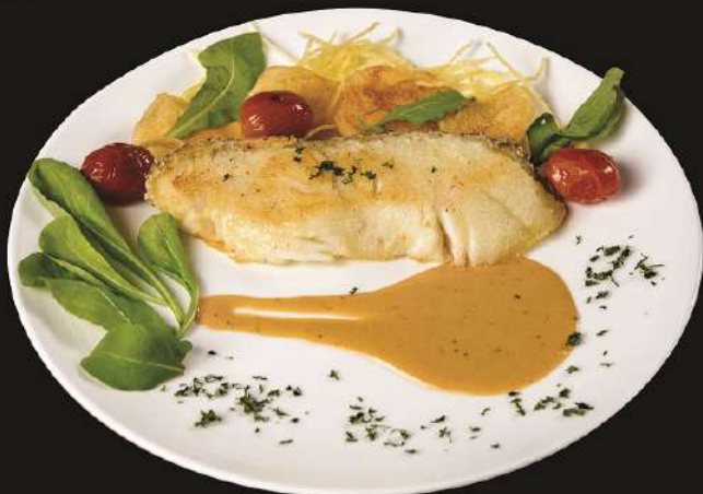
★ Grilled Snow Fish Miso Spicy 490.- 金目鯛スパイシーみそ焼き ปลาหิมะย่างซอสมิโซะรสเผ็ด