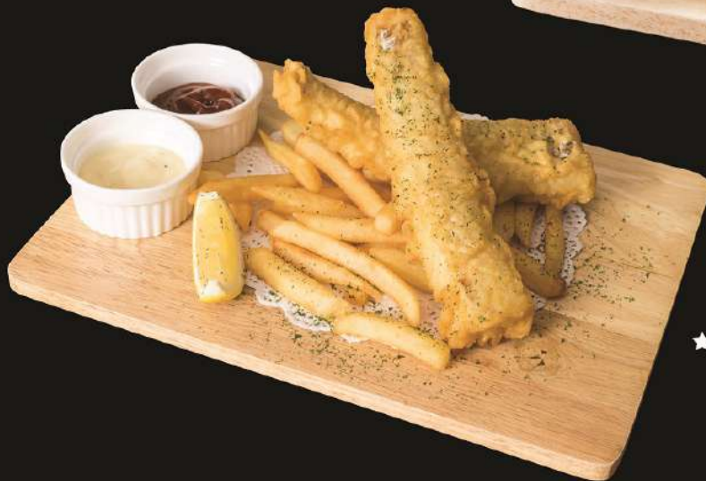
★ Seabass Fish & Chips 320.- フィッシュ・アンド・チップス ปลากระพงชุบแป้งทอดกับมันฝรั่งทอด