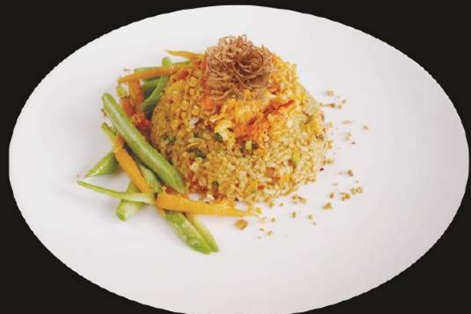
Taraba Fried Rice 280.- with Chilli Paste ทาราบ้าチャー-หันとチリペースト ข้าวผัดน้ำพริกเผาปูทหาระบะ