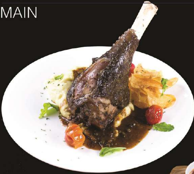
Lamb Shank ラムシャンク ขาเนื้อ