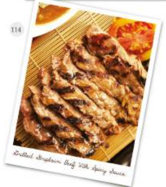
Grilled Striploin Beef With Spicy Sauce