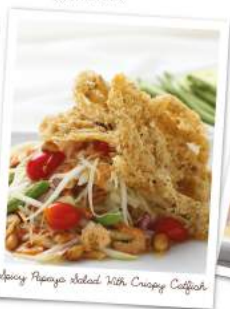
Spicy Papaya Salad With Crispy Catfish