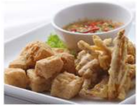
Deep Fried Tofu And Sliced Taro

84. Crispy Rice Crackers With Chicken Or Beef Green Curry ข้าวตังแกงไก่ หรือ เนื้อ 150.-