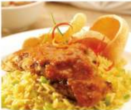
132 Chicken Satay With Curry Fried Rice Served With Shrimp Crackers