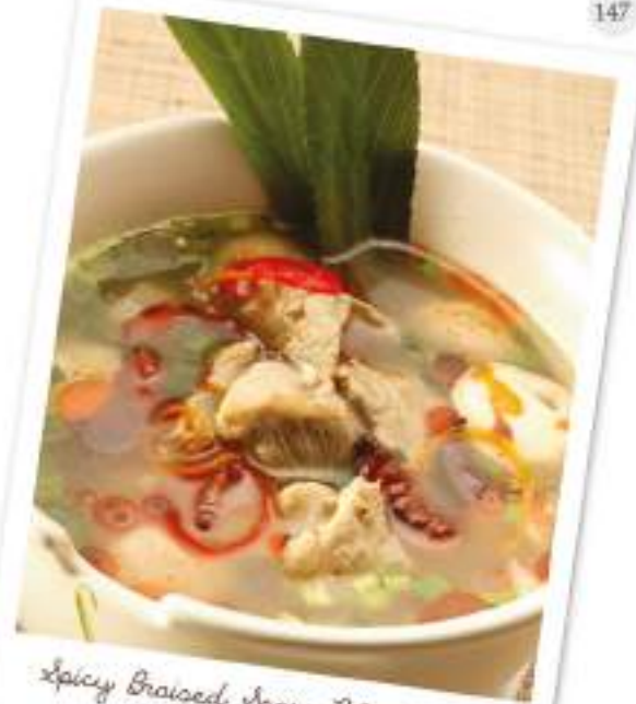
Spicy Braised Spare Rib Soup