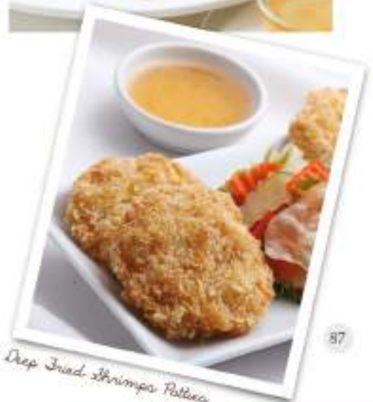
Deep Fried Shrimps Patties