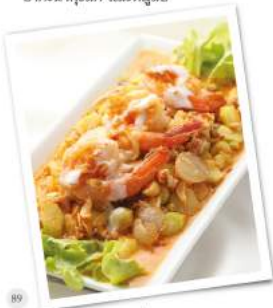
Spicy Kale salad With Shrimps And Minced Pork