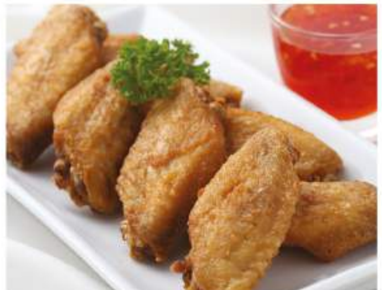
Crispy salted Chicken Wings