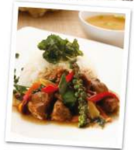
131 Steamed Rice With Spicy Braised Spare Ribs And Basil Leaves