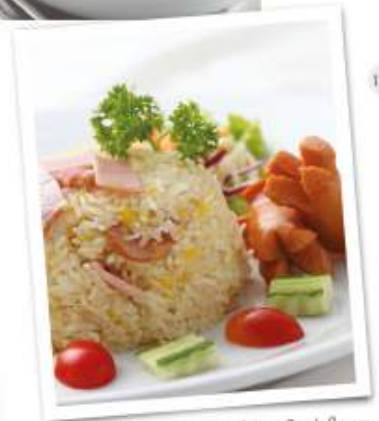
Fried Rice With Ham And Bacon