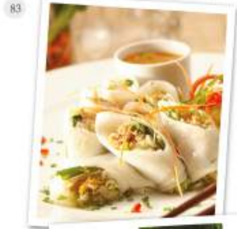
Fresh Rolled Noodles With Minced Pork & Shrimps