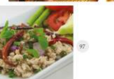
Grilled Striploin Beef With Spicy Sauce