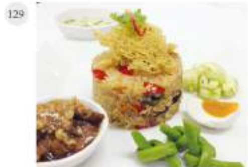
129 Fried Rice With Spicy Paste and Condiments