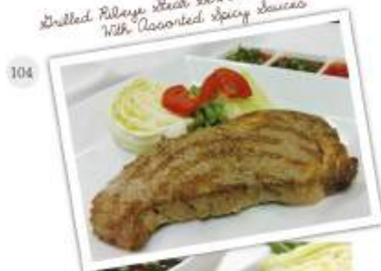
Grilled Ribeye steak served With Assorted Spicy Sauces