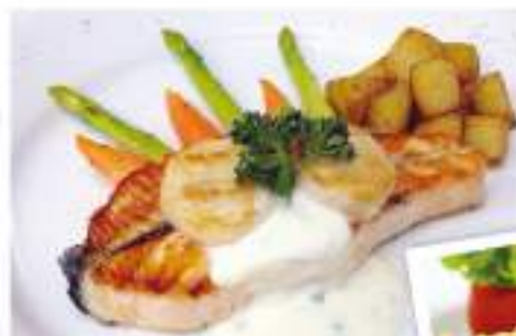
Grilled salmon and Alaska scallops