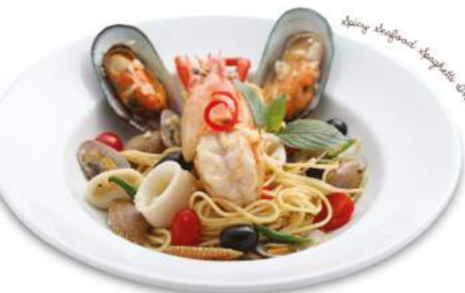
Spicy Seafood Spaghetti Or White Wine

61. Spaghetti Or Fettuccine With Tomato Sauce And Crispy Salid Fish 190.- สปาเก็ตตี้ หรือ เฟตตูกินี ซอสมะเขือเทศ ปลาสด