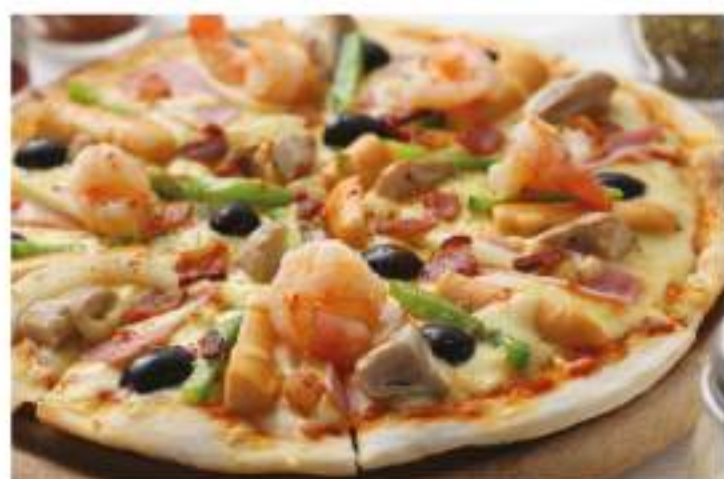
73 The Ninth Pizza