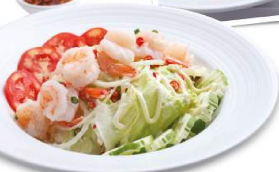
Spicy Shrimps Salad