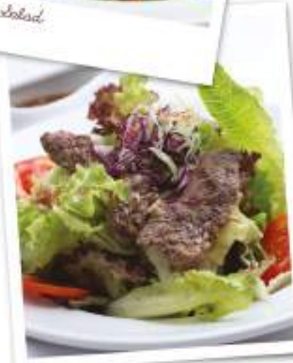
Grilled striploin Beef Salad With spicy Dressing