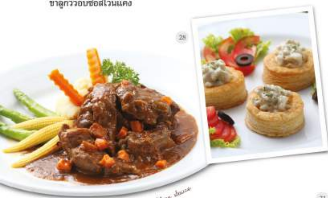
33 Ossobuco (Veal) in Red Wine Sauce