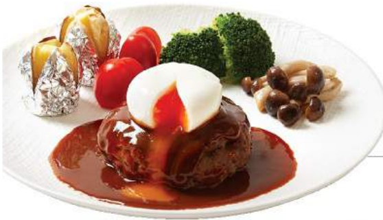
ビーフハンバーグ デミグラス / 和風ソースセット BEEF HAMBURG STEAK DEMIGLACE/ WAFU SAUCE SET ชุดแฮมเบอร์เกอร์ ราดเดมิกลาสหรือซอสญี่ปุ่น Beef Hamburg Steak Hokkaido Potato with Demiglace or Wafu Sauce