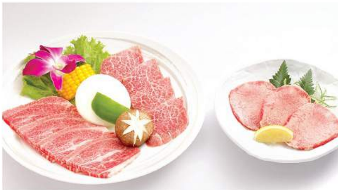
焼き肉セット B (タイフレンチ) YAKINIKU SET B (THAI FRENCH) ชุดย่างกึ่งเนื้อไทยเฟรนช์ Thai-French Yakiniku Set B