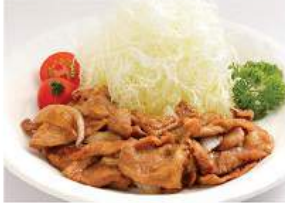
豚生姜焼き セット BUTA SHOGAYAKI SET ชุดหมูผัดขิง Stir-Fried Pork with Ginger