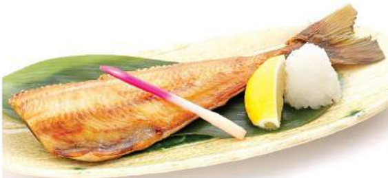
トロホッケ焼きセット 480THB TOROHOKKE YAKI SET ชุดปลาซีมน้ำเค็มย่าง Grilled Dried Atka Mackerel