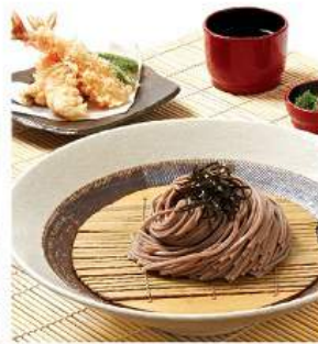
天ざるそば / うどん 360THB TEN ZARU SOBA / UDON โซบะ/ อุด้งทงน้ำจืดทงทงฟูระ ฮิโย Prawn Tempura and Chilled Noodles