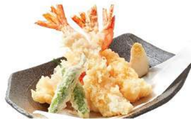
大海老天婦羅セット 520THB OHEBI TENPURA SET ชุดกุ้งทะเล Crispy Prawn Tempura