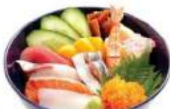
ちらし寿司 セット 860円 CHIRASHI SUSHI SET ちらし寿司 Assorted Fish, Nori and Topping Rice Bowl