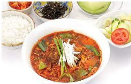
カルビラーメンセット KARUBI RAMEN SET ชุดราเมนเนื้อตุ๋นสไตล์เกาหลี Korean Style Spicy Beef Stewed Ramen