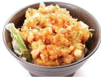
小海老と帆立の掻き揚げ丼セット 360THB KOEBI HOTATE KAKIAGE SET ข้าวทอดกุ้งและหอยนางรม Small Shrimp & Scallop Tempura on Rice