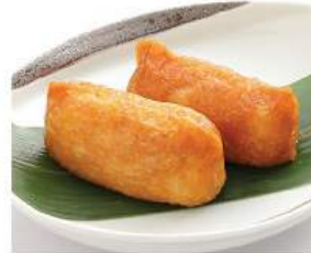
稲荷寿司 80THB INARI SUSHI 稲荷寿司 Sushi rice wrapped with Japanese fried tofu