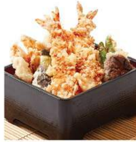
大名天重セット 520THB DAIMYO TENN-JYU SET ข้าวทอดกุ้งทะเลและผักทอด Crispy Prawn Tempura and Assorted Tempura on Rice Box