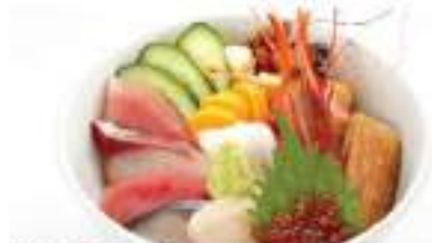
特上ちらしセット 1,190円 TOKU CHIRASHI SUSHI SET 特上ちらし寿司 Special Sashimi Assortment on Topping Rice Bowl

Price are subject to 10% Service Charge and 7% GST and 10% alcohol tax. 10% plus 10% plus 7%.