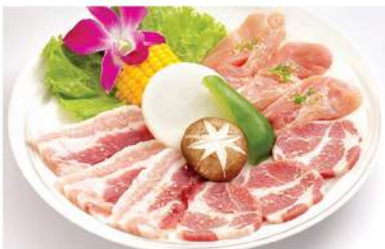
焼き肉セット C (豚、鶏) 540THB YAKINIKU SET C (PORK&CHICKEN) ชุดย่างกึ่งเนื้อหมูและไก่ Pork, Chicken Yakiniku Set C