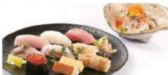
おまかせ握り (10貫) 1,950円 OMAKASE NIGIRI SET (10 Courses) おまかせ握り(10貫) Chef's selection of Hand Prepared Sushi Inspired from Japan

A la carte & lunch Rice, Miso soup, Salad set