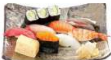
握り寿司 ランチセット 420円 NIGIRI LUNCH SET 握り寿司 Hand Prepared Sushi