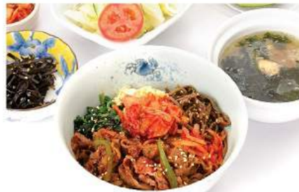
焼肉丼 (牛 / 豚) セット YAKINIKU DON SET (BEEF/ PORK) ข้าวห่อไข่เนื้อ / หมูย่าง Grilled Beef / Pork on Rice Bowl