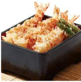
大海老天重 520THB OHEBI TENJYU ข้าวทอดกุ้งทะเล Crispy Prawn Tempura on Rice Box