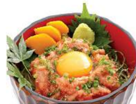
マグロユッケ丼セット MAGURO YUKKE DON SET ชุดข้าวหน้าマグโรรวมมิตร Minced Bluefin Tuna on Vinegar Rice Bowl