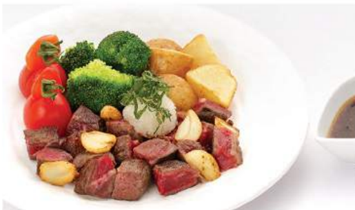
サイコロステーキセット SAIKORO STEAK SET ชุดสเต็กเนื้อลูกเต๋าซอสญี่ปุ่น / ซอสเดมิกลาส Special Selective Dice Cut Beef Steak and Hokkaido Potato with Japanese Sauce or Demiglace Sauce