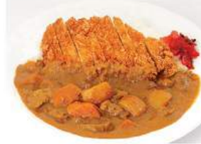
カツカレーライスセット KATSU CURRY RICE SET ชุดข้าวแกงจากรีหมูทอดทรงคัตสึ Pork Cutlet on Curry Rice