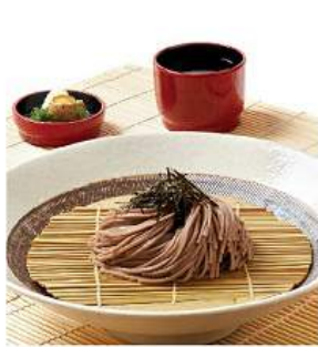
ざるそば / うどん 270THB ZARU SOBA / UDON โซบะ/ อุด้งเย็น Chilled Noodles