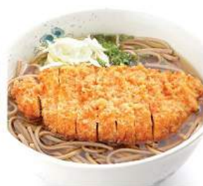
カツそば / うどん 300THB KATSU SOBA / UDON โซบะ/อุด้งทงน้ำจืดทงทงคัตสึ ฟูระ Soba or Udon Noodles in Hot Soup Topped with Pork Cutlet