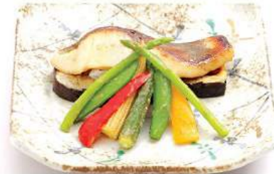
沖目鯛西京焼き 野菜添えセット 450THB OKIMEDAI SAIKYO-YAKI YASAI SOE SET ชุดปลาโกลี๋นย่างมิโซะ และผัก Grilled Silver Warehou with Miso and Vegetables