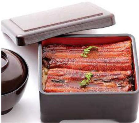
うな重セット 980THB UNA-JYU SET ข้าวทอดปลาไหลย่าง Grilled Freshwater Eel with Homemade Sauce on Rice Box