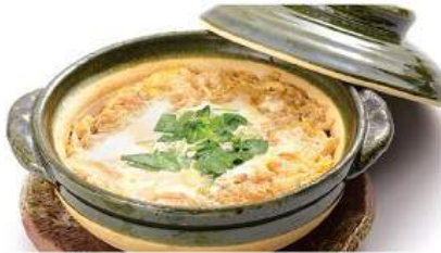
カツとじセット 330THB KATSU-TOJI SET ชุดหมูสันนอกทอดทางคัตสึในไข่หวาน Pork Cutlet Cooked in Sweet Egg Sauce