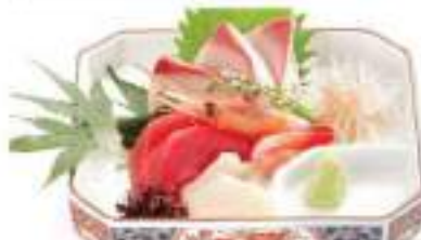
刺身セット 580円 SASHIMI SET 刺身 Assorted Sashimi