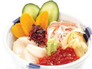
北海ちらしセット HOKKAIDO CHIRASHI SET ชุดข้าวหน้าฮอกไกโด Japanese Scallop, Salmon Roe and Crab on Vinegar Rice Bowl