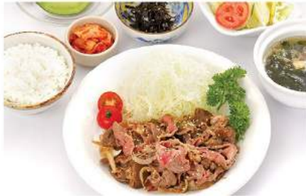
カルビ焼肉セット KARUBI YAKINIKU SET ชุดเนื้อย่างญี่ปุ่น Grilled Boneless Short Rib