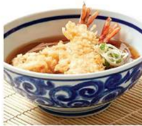
天婦羅そば / うどん 390THB TENPURA SOBA / UDON โซบะ/ อุด้งทงน้ำจืดทงทงฟูระ ฮิโย Crispy Prawn Tempura and Assorted Tempura Noodles in Bonito Broth