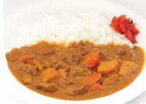
ビーフカレーライスセット BEEF CURRY RICE SET ชุดข้าวแกงจากรีเนื้อ Beef Curry Rice