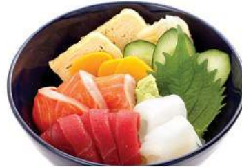
おまかせ三色丼セット OMAKASE SANSHOKU DON SET ชุดข้าวหน้า 3 อย่าง Bluefin Tuna, Salmon and Squid on Vinegar Rice Bowl