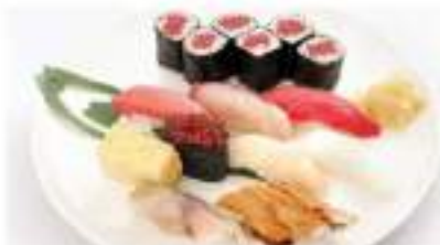
特上握りセット 1,180円 TOKUJYOU NIGIRI SET 特上握り寿司 Extra Special Hand Prepared Sushi