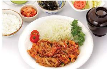
豚焼肉セット BUTA YAKINIKU SET ชุดเนื้อย่างญี่ปุ่น Grilled Pork