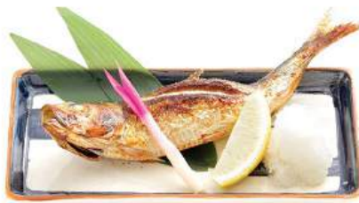
真いわし塩焼きセット 280THB MAIWASHI SHIO YAKI SET ชุดปลาซาร์ดีนย่างเกลือ Grilled Spotline Sardine with Salt