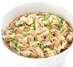
豚肉そば / うどん (牛 / 豚) 395/300THB NIKU SOBA / UDON (BEEF/ PORK) โซบะ/อุด้ง (ทงน้ำร้อน / ทง) ฟูระ Soba or Udon Noodles In Hot Soup Topped with Simmered Beef/Pork