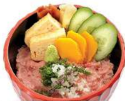
ねぎとろ丼セット NEGI TORO DON SET ชุดข้าวหน้าปลาทูน่าใส่หัวหอมใหญ่ Minced Fatty Tuna and Spring Onion on Vinegar Rice Bowl