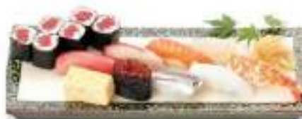
上握りセット 790円 JYO NIGIRI SET 上握り寿司 Special Hand Prepared Sushi