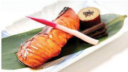
サーモンの塩 / 照りセット 390THB SALMON SHIO/TERI YAKI SET ชุดปลาแซลมอนย่างเกลือ/ 照ริ Grilled Salmon with Salt or Teriyaki