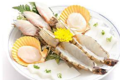
焼き肉セット D (海鮮) 1,200THB KAISENYAKI SET D ชุดย่างกึ่งซีฟู้ด Seafood Yaki Set D

Price are subject to 10% Service charge and 7% VAT อาหารไม่รวมค่าบริการ 10% และภาษีมูลค่าเพิ่ม 7%