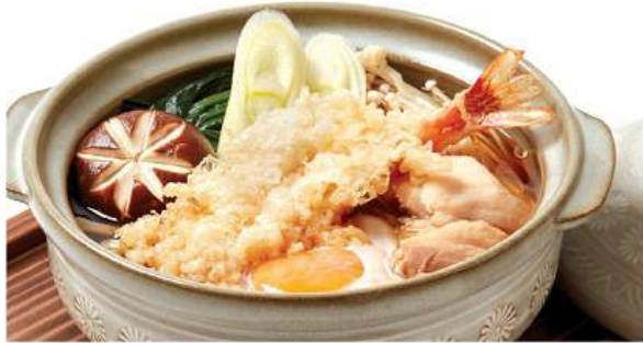
鍋焼きうどん 390THB NABEYAKI UDON อุด้งร้อนในราวนะมิตสึ Crispy Prawn Tempura, Chicken Noodles In Bonito Broth Served In Hot Pot