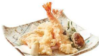
天婦羅セット 380THB TENPURA SET ชุดต่างๆรวม Assorted Tempura