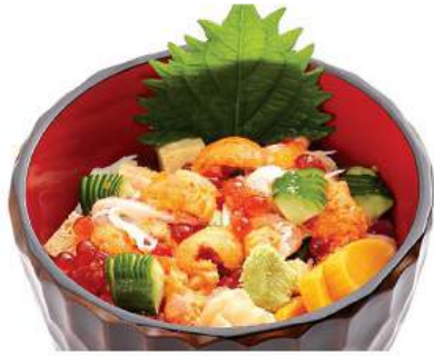
上ばら寿司セット JYO BARA SUSHI SET ชุดข้าวหน้าปลาดิบรวมมิตรพิเศษ Special Scattered Some Diced Seafood on Vinegar Rice Bowl