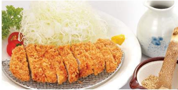
トンカツセット 320THB TONKATSU SET ชุดหมูสันนอกทอดทางคัตสึ Pork Cutlet