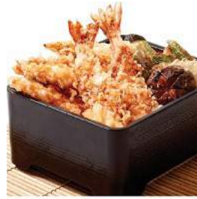
天重セット 380THB TEN-JYU SET ข้าวทอดกุ้งทะเลและผักทอด Assorted Tempura on Rice Box