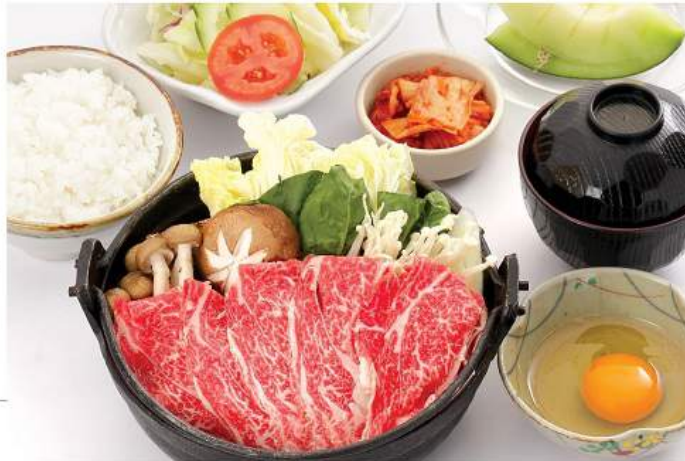
すき焼き (牛 / 豚) セット SUKIYAKI SET (BEEF / PORK) ชุดสุกี้เนื้อ / หมู Sukiyaki (Beef /Pork) 790/480THB