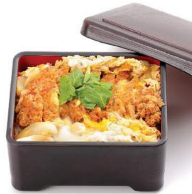
カツ重セット 300THB KATSUJYU SET ข้าวทอดหมูทอดทรงเครื่อง Pork Cutlet with Egg on Rice