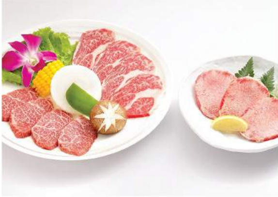
焼き肉セット A (特上) 1,200THB YAKINIKU SET A (PREMIUM) ชุดย่างกึ่งเนื้อพรีเมียม Premium Beef Yakiniku Set A