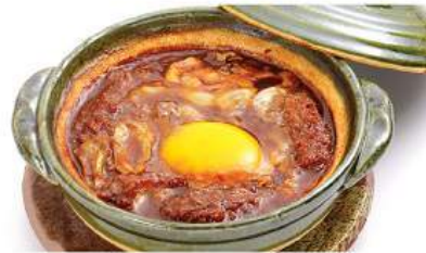
カツ味噌煮セット 330THB KATSU MISONI SET ชุดหมูสันนอกทอดทางคัตสึในไข่มิโซะรสหวาน Pork Cutlet Cooked in Egg Miso Paste