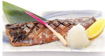
鯖塩 / 照り焼きセット 290THB SABA SHIO/TERI YAKI SET ชุดปลาซาร์ดีนย่างเกลือ/ 照ริ Grilled Mackerel with Salt or Teriyaki