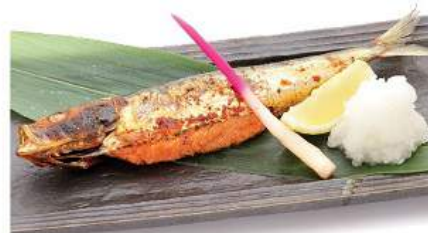
真いわし明太子焼きセット 350THB MAIWASHI MENTAICO YAKI SET ชุดปลาซาร์ดีนยัดไข่ปลาแซลมอนย่างเกลือ Grilled Spicy Seasoned Cod Roe in Spotline Sardine