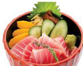
ばちとろ丼セット BACHI TORO DON SET ชุดข้าวหน้าปลาทูน่า Fatty Bigeye Tuna and Spring Onion on Vinegar Rice Bowl