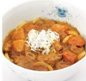
カレーそば / うどん 290THB CURRY SOBA / UDON อุด้งร้อนทงน้ำจืดทงทงคั่ว Udon Noodles Topped with Curry