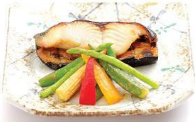
銀鱈 西京 / 塩 / 照り焼きセット 790THB GINDARA SAIKYO/ SHIO/ TERI YAKI SET ชุดปลาหัวตะกั่วย่างมิโซะ/ เกลือ/ 照ริ และผัก Grilled Black Cox Fish with Miso, Salt or Soy Sauce and Vegetables