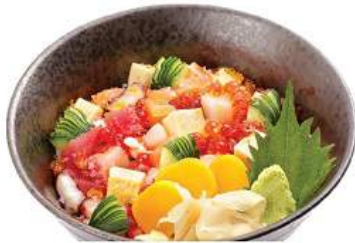
ばら寿司ランチセット BARA SUSHI LUNCH SET ชุดข้าวหน้าปลาดิบรวมมิตร Scattered Diced Fish, Seashell on Vinegar Rice Bowl