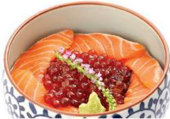
サーモン親子丼セット SALMON OYAKO DON SET ชุดข้าวหน้าปลาแซลมอนกับไข่ปลาแซลมอน Salmon and Salmon Roe on Vinegar Rice Bowl