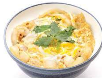
親子丼セット 290THB OYAKO DON SET ข้าวทอดไก่ Chicken with Egg on Rice

Price are subject to 10% Service charge and 7% VAT อาหารไม่รวมค่าบริการ 10% และภาษีมูลค่าเพิ่ม 7%