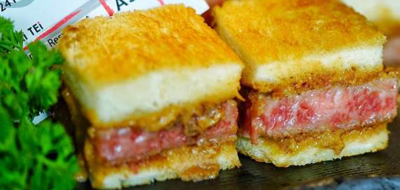
Imperial Wagyu Katsu Sando 皇帝和牛カツサンド 2,480 Baht (Avaliable Only 6 Dishes/Day)