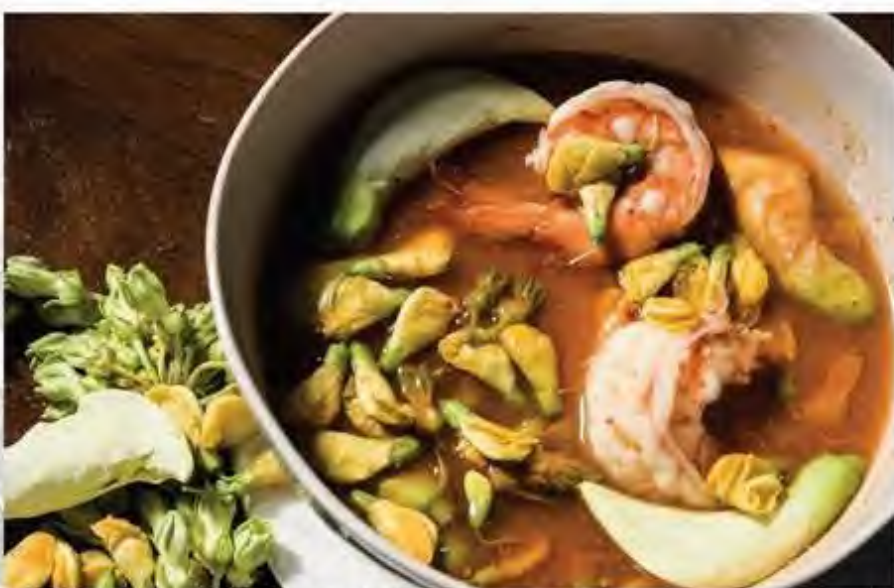
แกงส้มกุสม (ดอกไม้สามฤดูกาล) Sour soup with Thai edible flowers 时令鲜花虾汤 220.-