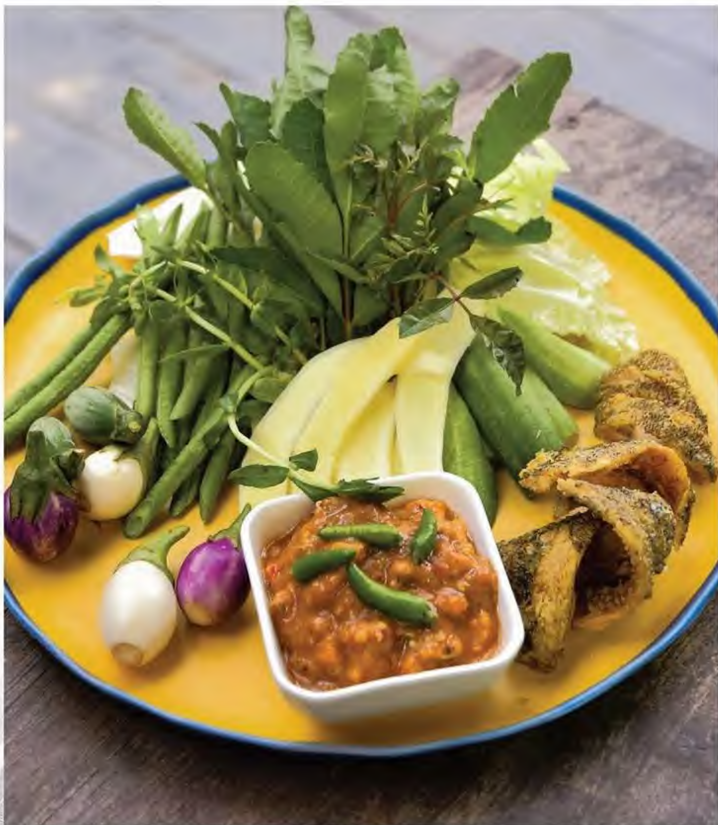
น้ำพริกไขปู