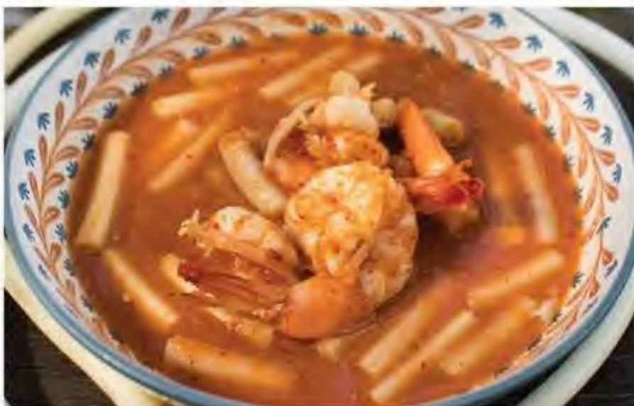
แกงส้มไหลบัว Sour soup with Lotus Root 酸辣罗望子藕带虾汤 220.-