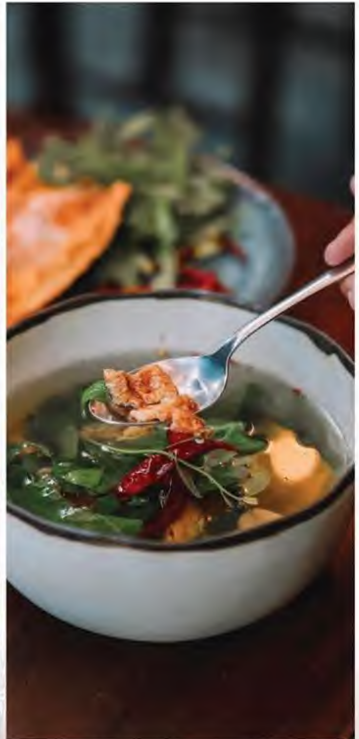
ต้มยำกุ้ง (น้ำซัน) 冬阴功汤 (Tom Yum Kung) Shrimp soup