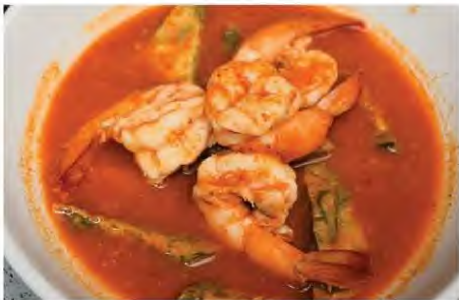
แกงส้มชะอมไข่ Sour soup with Acacia omelet 酸辣罗望子臭 菜蛋饼虾汤 220.-