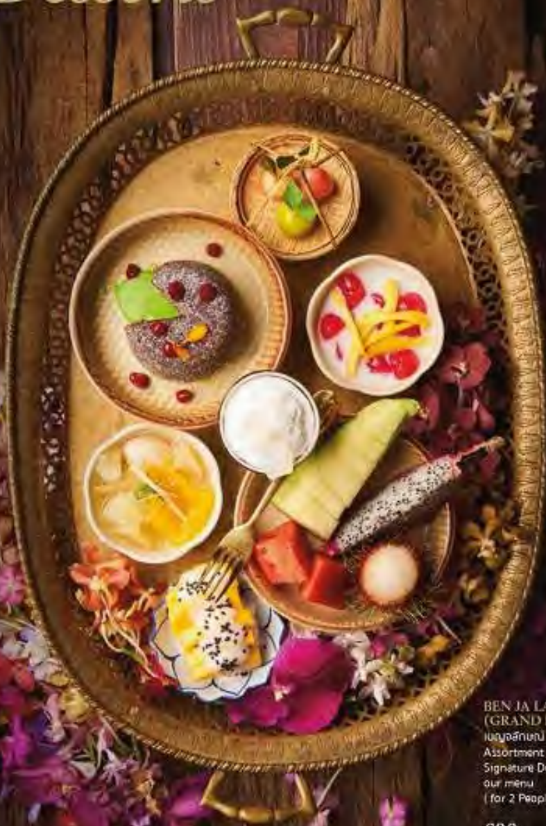
BEN JA LAK (GRAND DESSERT) เบญจาทาน Assortment of our Signature Desserts from our menu (for 2 People)