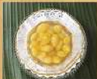
164. แป๊ะก๊วยร้อน/เย็น 80 Ginkgo in hot or cold sugar syrup