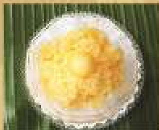
158. ซากุณอ่อน 65 Boiled sago with ice cantaloupe syrup