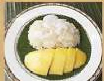
166. ข้าวเหนียวมะม่วง 95 Mango sticky rice