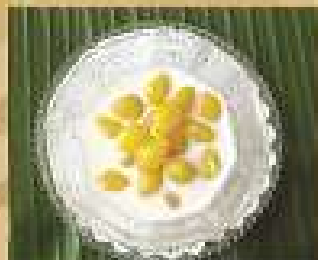
163. แป๊ะก๊วยแอมลี่ร้อน/เย็น 80 Ginkgo in hot or cold milk