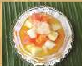
159. ผลไม้สดหลายแก้ว 65 Mixed fresh fruits in orange juice syrup