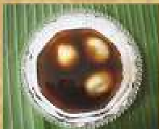
160. ข้าวตอกน้ำซิง 65 Black sesame seed dumplings in hot ginger syrup ข้าวตอกน้ำซิงใส่แปะก๊วย 80 Black sesame seed dumplings and ginkgo in hot ginger syrup