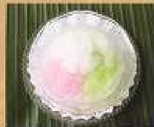
156. ซาหริ่ม 65 Mung bean vermicelli