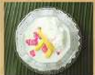
157. ทับทิมกรอบ 65 Tub-tim krob Cubed ground nuts in coconut milk & syrup