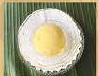
161. ไอศกรีมรสต่าง ๆ 65 A choice of ice cream flavour 162. ไอศกรีมแอมลี่ 80 Ice-cream with jelly