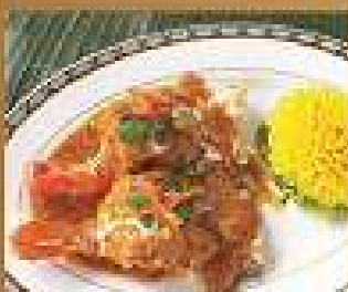
49. กุ้งแม่น้ำ 2 ตัว 480/520 River Prawns in chili paste