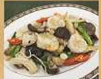
88. เห็ดรวมผัดกุ้ง 260 / 390 Stir-fried mixed mushroom with shrimps