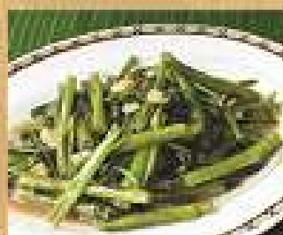
94. ผัดกูดผัดกะปิ 120 / 180 Stir-fried morning glory with shrimp paste sauce