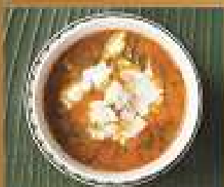
45. แกงหัวหนังกุ้ง 300/450/600 Crab meat and acacia red curry