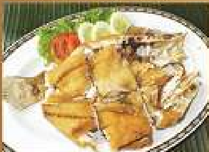
ปลาแซลมอนทอดน้ำปลา 490 - 540 Deep-fried Sea Bass with fish sauce