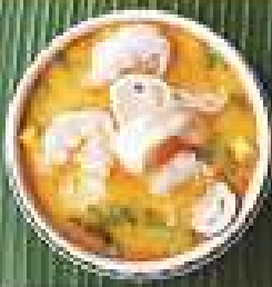
55. ต้มยำกุ้ง 280 / 420 / 560 Tom yum with shrimps