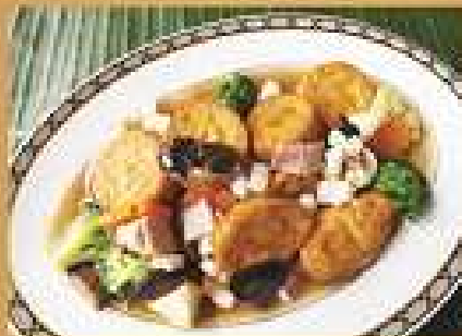
เต้าหู้ผัดหมูเค็ม 200 / 300 Tofu, ham, and vegetables in brown sauce