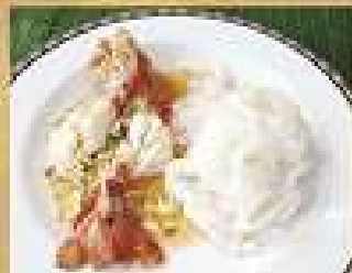
143. ก๋วยเตี๋ยวกุ้งนึ่ง 240-260

Stir-fried spaghetti with River Prawns in Tom Yum sauce