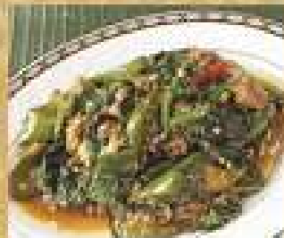
91. ผัดมะเขือยาว 180 / 270 โพะพาทนุขิม Stir-fried Thai eggplant with minced pork and sweet basil