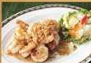
100. กุ้งทอด 320 / 480 กระเทียมพริกไทย Stir-fried shrimps with garlic and pepper