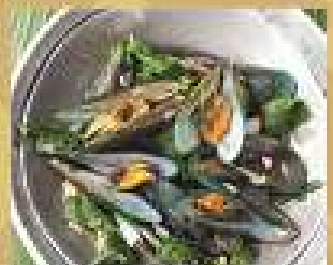
118. หอยแมลงภู่นึ่ง สมุนไพรสด 200 / 300 Steamed mussels with sweet basil