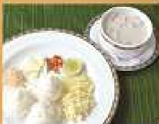
130. ขนมจีนชามบัว 250 Fish nuggets in coconut milk with steamed rice noodle