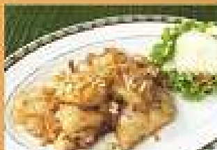
105. เนื้อปลาเก๋า 320 / 480 ทอดกระเทียมพริกไทย Stir-fried sliced Grouper with garlic and pepper