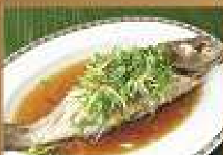
107. ปลาเก๋นึ่งซีอิ๊ว 490-540 Steamed Grouper with soy sauce