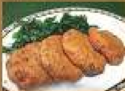
อาหารยอดนิยม Fried Pork Meatballs with pork 149