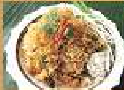
อาหารยอดนิยม Crispy rice noodles in spicy sauce with beef and pork 149