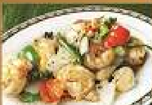
103. กุ้งผัดพริกไทยดำ 320 / 480 Stir-fried shrimps with black pepper