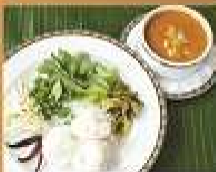
131. ขนมจีนน้ำยาปู 250 Crab meat curry with steamed rice noodle