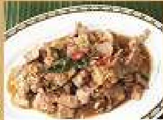
67. หมู/ไก่ ผักกะปิ 220 / 330 กะปิโขลกพริกขี้หนูสด Stir-fried pork or chicken with shrimp paste and lemongrass เนื้อผัดกะปิตะไคร้ 300 / 450 พริกขี้หนูสด Stir-fried beef with shrimp paste and lemongrass