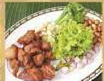
16. หมูเค็มทอดพริกขี้หนู 220 / 330 Deep fried preserved pork ribs