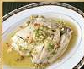
14. ไก่ทอดน้ำปลา 220 / 330 Steamed Thai country chicken with garlic and lime