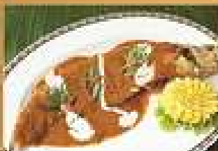
104. ปลานึ่งฉง 490-550 ทอดในน้ำพริก Deep fried Sheat fish in chili paste