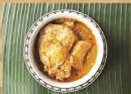
แกงมัสมั่นไก่ Chicken massaman curry 220 / 330