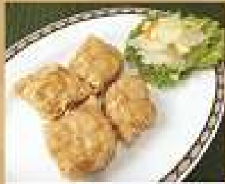
9. พอมน้ำกุ้งทอดคั่วไข่ 220 Deep fried shrimp paste in dry bean curd rolls