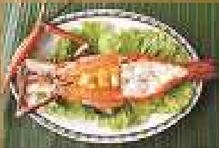
97. กุ้งแม่น้ำย่างถ่าน 1 ตัว 550-900 Charcoal grilled large River Prawn (per piece) กุ้งขนาดกลาง 1 ตัว 240-260 Charcoal grilled River Prawn (per piece)