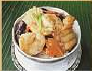
136. ข้าวอบทะเล 250

Baked rice with stir-fried seafood and ginger