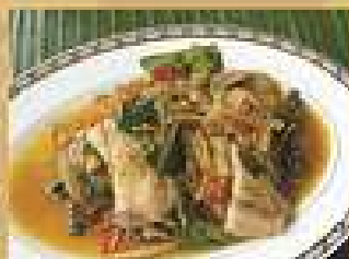
75. ผัดปลาช่อน 200 / 300 Stir-fried catfish with kaempfer and chili