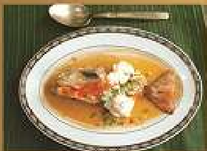
กุ้งแม่น้ำใหญ่ผัดกระเทียม 1 ตัว 550 - 900 กุ้งแม่น้ำผัดกระเทียม 1 ตัว 240 - 260 Steamed large River Prawn / or River Prawn with garlic and lime sauce