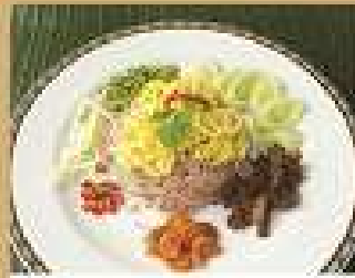
135. ข้าวผัดลูกกะปิ 190