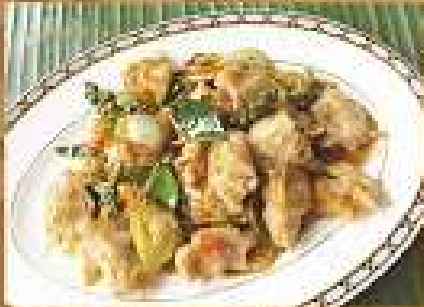
ปลารวมชิ้นทอดกระเทียม 220 / 330 / 400 Fry-fried fish nuggets with kaeoyster and chili