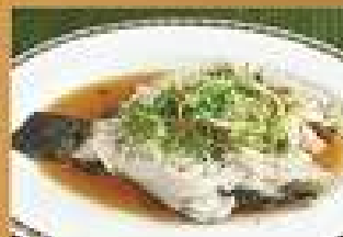
106. ปลาเก๋นึ่งซีอิ๊ว 650-1,200 Steamed Goby fish with soy sauce