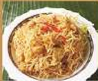
145. หมี่กรอบ Crispy rice noodle with sweet and sour sauce