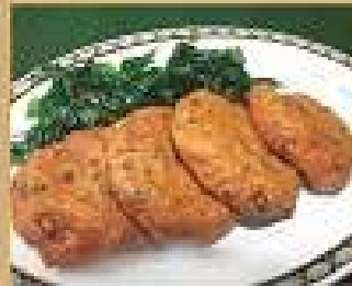
6. ทอดกล้วยปลาหมึก 220 Deep fried spicy fish cakes