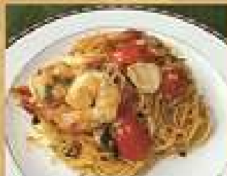
142. สปาเก็ตตี้ผัดต้มยำกุ้ง 260

Spicy stir-fried spaghetti and holy basil with shrimps or beef