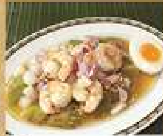
30. ยำมะเขือยาว 200 / 300 Spicy grilled Thai egg plants salad with shrimps