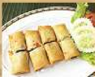
17. บั๊วเนื้อทอด 180 Deep fried spring rolls