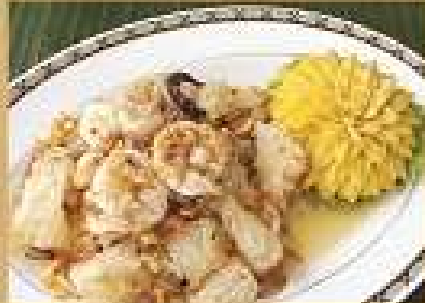
ส้มตำโรย Spicy pomelo salad with shrimps 200 / 300