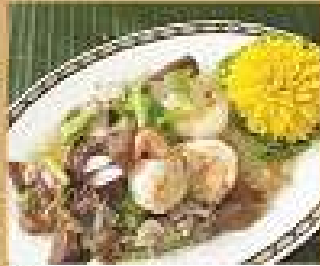
25. ยำวุ้นเส้น 200 / 300 Spicy glass noodle with pork chop and shrimps