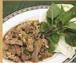
26. หมูย่างน้ำจิ้ม 220 / 330 Grilled pork with spicy dip เนื้อย่างน้ำจิ้ม 300 / 450 Grilled beef with spicy dip