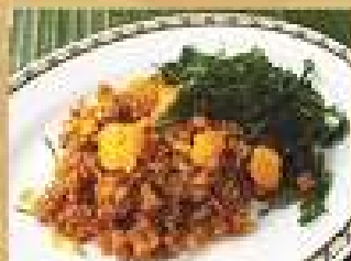
71. ผัดปลาช่อนน้ำจิ้ม 200 / 300 Stir-fried fluffy Catfish with chili