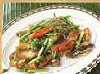
74. ปลาช่อนผัด 200 / 300 ผัดชิ้นปลา Stir-fried sliced Snake-head fish with celery