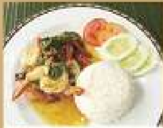
132. ข้าวราดกะเพราหมู/ไก่ 190

Steamed rice topped with stir-fried pork or chicken with holy basil