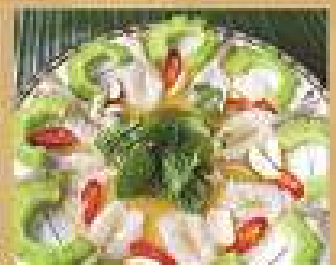
39. กุ้งแช่น้ำปลา 300 / 450 Fresh shrimps baked in fish sauce