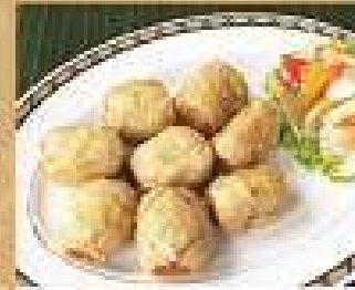
11. บั๊วจืดทอด 280 Deep fried crab meat balls