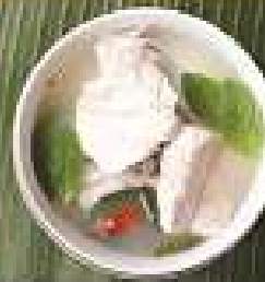
57. ต้มยำเนื้อปลาหมัก 260 / 390 / 520 โรยใบพริก Spicy and sour sliced Grouper soup with sweet basil