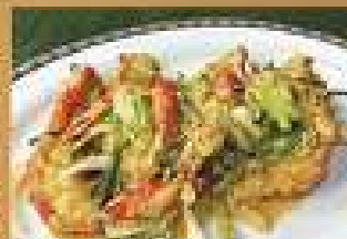
102. กุ้งผัดผงกระหรี่ 480-520 2 ตัว Stir-fried River Prawn with curry powder