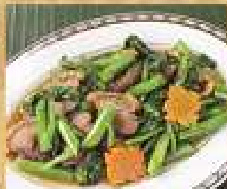
90. ผัดคะน้าฮ่องกง 200 / 300 หมูกรอบ Stir-fried Chinese kale with crispy pork