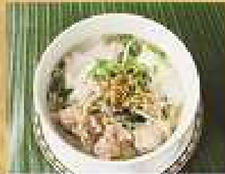
138. ก๋วยเตี๋ยวน้ำหมูสับ/ไก่ 190

Rice noodle soup with minced pork, or chicken