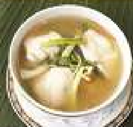
58. แกงจืดเนื้อปลาหมัก 260 / 390 / 520 โรยส้ม Sliced Grouper soup with salted Chinese prunes and ginger