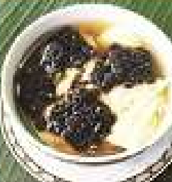
61. แกงจืดหมูสับ 180 / 270 / 360 หมูสับ (ใส่พริกไทย) Minced pork soup with tofu and seaweed