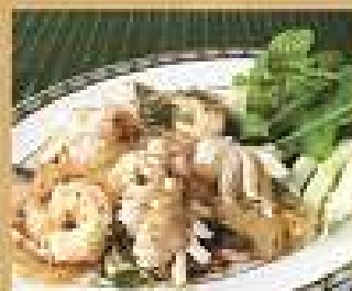
38. สามัญเส้น 280 / 420 Spicy seafood salad with glass noodle-North-eastern style