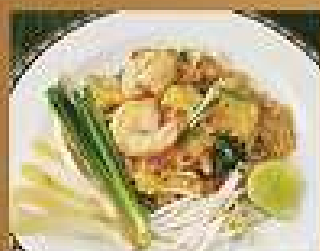
124. ก๋วยเตี๋ยวผัดไทกุ้งสด 250 Pad Thai with shrimps