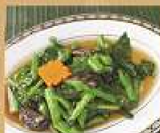
95. คะน้าฮ่องกง 120 / 180 ผัดน้ำมันหอย Stir-fried Chinese kale with oyster sauce