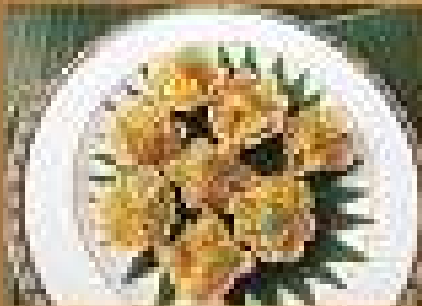
อาหารยอดนิยม Mixed Fried Chicken, Beef, Pork, and Prawns served in spicy sauce 149