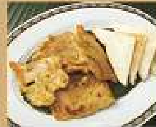
7. หมูเสวยเค็ม 220 / 330 Pork satay