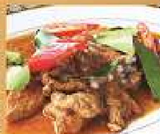
51. พะแนงเนื้อ / กุ้ง 280/420/560 Beef or shrimps in coconut curry paste