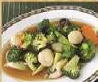
89. บดิลอกโคตี 320 / 480 ผัดรวมเห็ด Stir-fried scallops and broccoli with oyster sauce