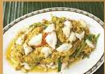
เนื้อปูผัดผงกระเทียม 600 Stir-fried crab meat with curry powder