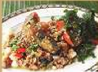
65. หมูกรอบ /ไข่เค็มรวีว 240 / 360 ผักขมิ้น Stir-fried crispy pork or preserved egg with holy basil and chili