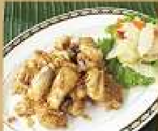
111. ปลาหมึกผัดกระเทียม 240 / 360 Stir-fried squid with garlic and pepper