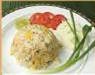
133. ข้าวผัดปู/กุ้ง 250

Seamed rice topped with stir-fried shrimps, beef, or sliced Grouper with holy basil