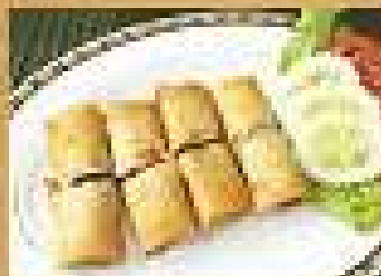
อาหารยอดนิยม Deep Fried Spring Rolls 149