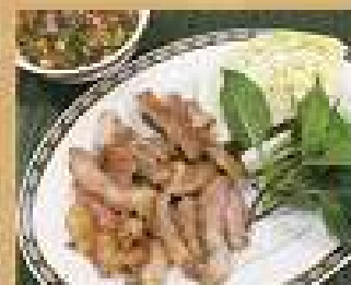
19. หมูย่างพริกขี้หนู 220 / 330 Grilled pork with spicy dip เนื้อย่างพริกขี้หนู 300 / 450 Grilled beef with spicy dip