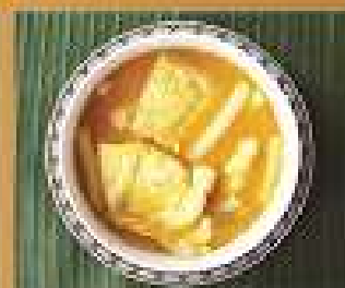
48. แกงส้มขมิ้นไก่ 220/330/440 Spicy and sour turmeric yellow curry with sliced Grouper