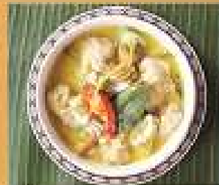
42. แกงเขียวหวาน ลูกชิ้นปลาทราย Fish nuggets green curry