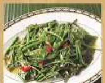
96. ผัดขี้เหล็กมะระขี้นก 120 / 180 Stir-fried bitter-melon with oyster sauce