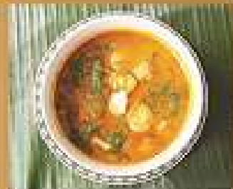
155. แกงเผ็ด Mushroom and acacia red curry