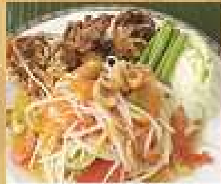
33. ส้มตำปูม้าทอด 280 / 450 Spicy papaya salad with fried soft shell crab