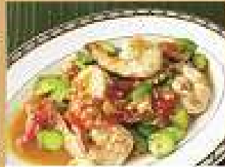
66. ตระกูลผักคั่ว 280 / 420 Stir-fried sator beans in spicy shrimp paste with shrimps ตระกูลผักหมูชิ้น 220 / 330 Stir-fried sator beans in spicy shrimp paste with minced pork