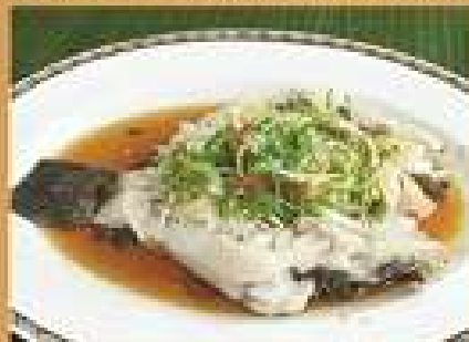
ปลาบู่ผัดซีอิ๊ว 650 - 1,200 Steamed Goby fish with soy sauce