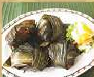
13. ไก่ทอดใบเตย 200 Deep fried chicken wrapped in pandan leaves