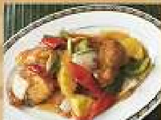
77. ผัดเนื้อหวาน 280 / 420 กุ้ง / ปลา Stir-fried shrimps or fish in sweet and sour sauce