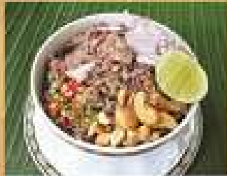
137. ข้าวอบถั่วดำเค็ม 190

Baked rice with stir-fried seafood and ginger