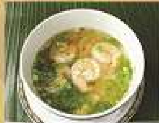
139. ข้าวต้มเครื่อง 250

Rice noodle soup with shrimp, sliced Grouper, or seafood