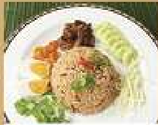
134. ข้าวผัดน้ำพริกถนอม 190