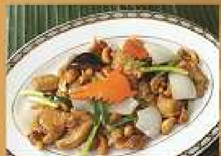
ไก่ผัดเม็ดมะม่วงหิมพานต์ 220 / 330 Stir-fried chicken with cashew nuts