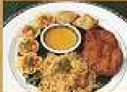
อาหารยอดนิยม A Mixed Appetizer A 149