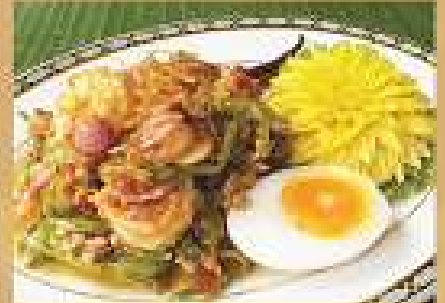
ส้มตำหอย Spicy wing bean salad with shrimps 200 / 300