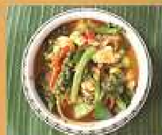
47. แกงป่า ลูกชิ้นปลาทราย/กุ้งสับ Fish nuggets or minced shrimps Thai country curry