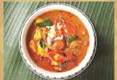
แกงเผ็ดเป็ดย่าง Roasted duck red curry 220 / 330 / 440