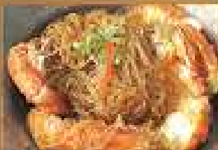
99. กุ้งนางอบวุ้นเส้น 480-520 หม้อดิน 2 ตัว Baked two River Prawns and glass noodle - Chinese style