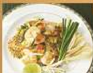
125. ก๋วยเตี๋ยวเส้นแก้วผัดไทกุ้งสด 250 Glass noodle Pad Thai with shrimps