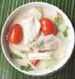
59. ต้มยำไก่ 200 / 300 / 400 Chicken soup with coconut milk - Tom Kha Gai