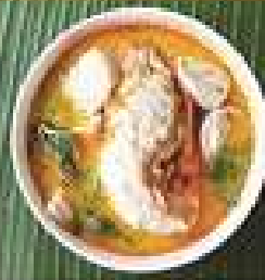
53. ต้มยำกุ้งนาง 240-260 ต่อ 1 ตัว Tom yum River Prawn (one piece)