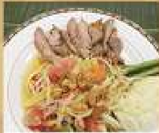
32. ส้มตำหมูย่าง 220 / 330 Spicy papaya salad with grilled pork