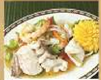
31. ยำทะเลขี้เหล็ก 280 / 420 Spicy and sour seafood salad