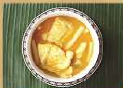
แกงส้มปี๋ทมิฬ Spicy and sour turmeric yellow curry with sliced Grouper 220 / 330 / 440