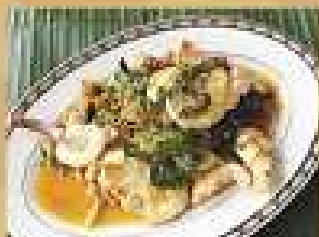
69. ผัดน้ำจิ้ม 280 / 420 Stir-fried seafood with holy basil and chili