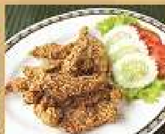
18. หมูทอดขาว 220 / 330 Deep fried pork with white sesame seeds