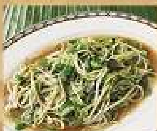
93. บดิลอกตระเวน 120 / 180 ผัดน้ำมันหอย Stir-fried sandalwood with oyster sauce