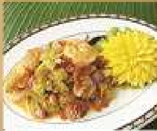
28. ยำมะขามขี้เหล็ก 200 / 300 Spicy and sour bitter melon salad with shrimps