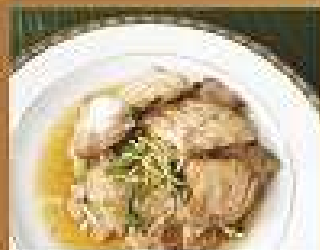
128. ก๋วยเตี๋ยวราดหมู/ไก่ ปลาหมึกซีอิ๊ว 250 Fried rice noodle with sliced Grouper in Chinese soy sauce