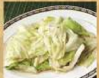
92. กะหล่ำปลีผัดน้ำปลา 120 / 180 Stir-fried cabbages with fish sauce