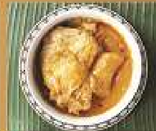
43. แกงมัสมั่นไก่ 220/330 Chicken massaman curry