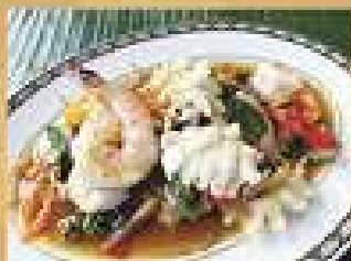
70. ผัดน้ำจิ้ม 280 / 420 Stir-fried seafood with kaempfer and chili