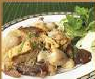
148. สลัดผัก Spicy vegetarian salad - Northeastern style with glass noodle