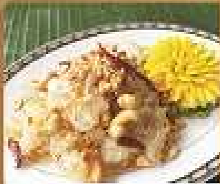
144. ส้มตำโรย ผักหวาน Spicy pomelo or mango salad