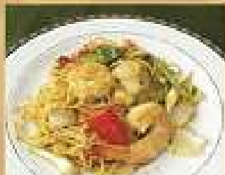
140. สปาเก็ตตี้ผัดผงกะหรี่กุ้ง 260

Boiled rice soup with shrimps, or sliced Grouper