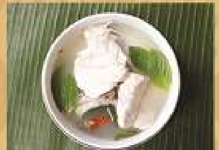
ส้มตำเนื้อปลาหมึกน้ำใสรสเปรี้ยว Spicy and sour sliced Grouper soup with sweet basil 260 / 390 / 520