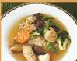
126. ก๋วยเตี๋ยวราดหมู/ไก่ 190 Stir-fried rice noodle with pork or chicken in Chinese gravy