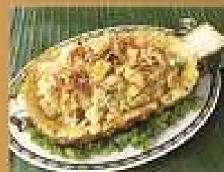
123. ข้าวอบสับปะรด Baked pineapple curry rice 260