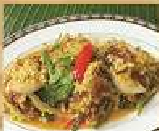
119. ปูนิ่มผัดผงกะหรี่ 320 / 480 Stir-fried soft shell crab with curry powder