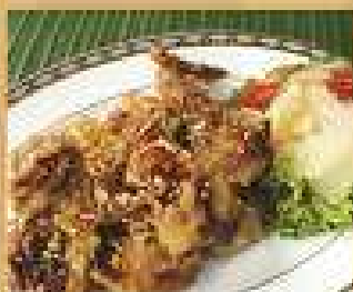
120. ปูนิ่มทอดกระเทียม 320 / 480 พริกไทย Stir-fried soft shell crab with garlic and pepper