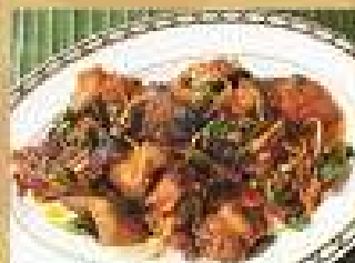
72. ปลาช่อนผัดพริก 200 / 300 ผัดเนื้อ Stir-fried Catfish with chili