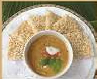
5. ข้าวตังหั่นสี่เหลี่ยม 130 / 195 Rice crackers with minced pork and prawn dip