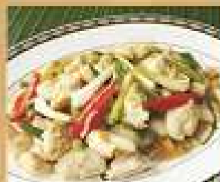
121. เนื้อปูผัดพริกเหลือง 800 Stir-fried crab meat with chili เนื้อปูผัดต้นหอม 800 Stir-fried crab meat with scallion