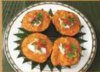
หมัมนึ่งปลา / กุ้ง ต่อ 1 ชิ้น 65 Steamed fish or crab curry cake per piece