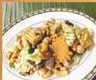
149. ผัดผัก Stir-fried vegetarian meats with black mushroom