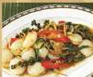
115. หอยเชลล์ผัดขี้เหล็ก 420 / 630 Stir-fried scallops with kaempfer and sweet basil