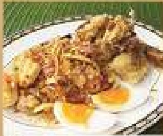
24. ยำบัวปลิงต้มทอด 280 / 420 Spicy banana flower bud salad with fried soft shell crab