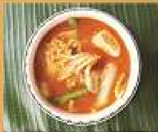
154. แกงส้ม Mixed vegetables in spicy tamarinated soup