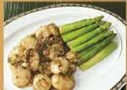
พุดผัดซีอิ๊วกับน้ำจิ้มหมึก 500 / 750 Stir-fried scallops with oyster sauce