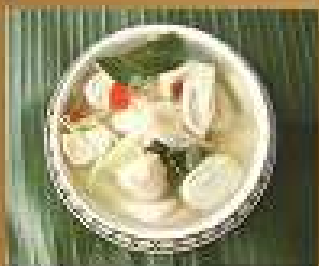
152. ซุปเห็ด Spicy and sour mushroom soup