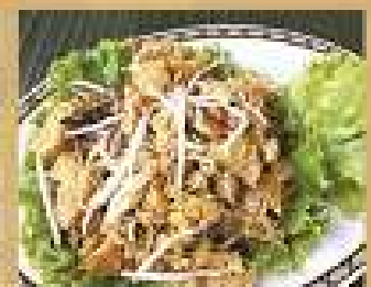
20. กระต่ายทอด 220 / 330 ผัดน้ำจิ้ม Stir-fried fish maw with bean sprouts and eggs