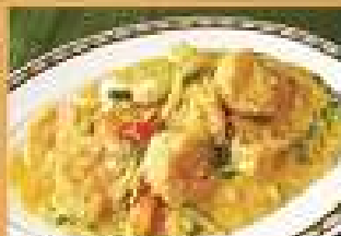
101. กุ้งผัดผงกระหรี่ 320 / 480 Stir-fried shrimps with curry powder