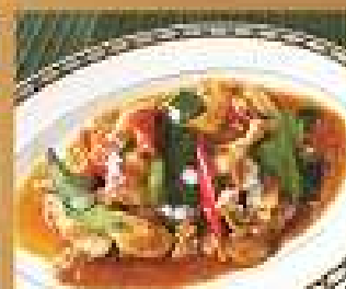
52. พะแนงหมู/ไก่ 220/330/440 Pork or shrimps in coconut curry paste