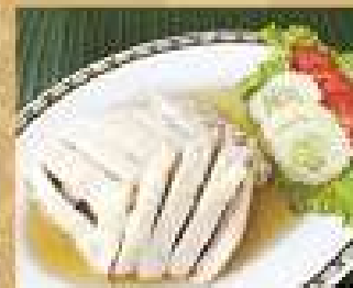
15. ไก่ทอดพริกขาว 220 / 330 Thai country chicken in whisky