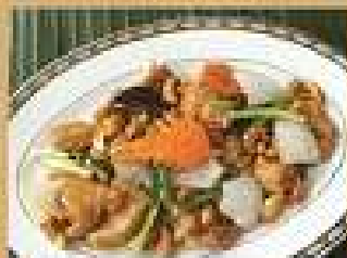
79. ไก่ผัด 220 / 330 เม็ดมะม่วงหิมพานต์ Stir-fried chicken with cashew nuts