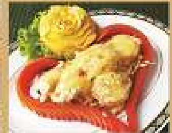
8. กุ้งทอดพริกขี้หนูสด 260 Fried shrimps topped with cream salad