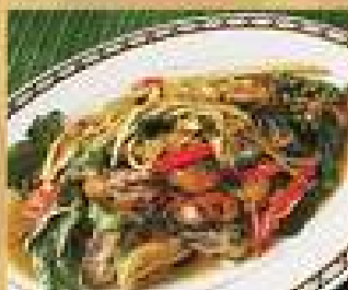
116. หอยแมลงภู่นึ่งขี้เหล็ก 200 / 300 Stir-fried mussels with kaempfer and sweet basil