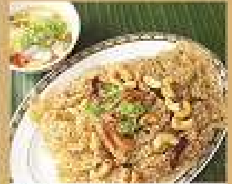
27. ปลาช่อนฟู 200 / 300 Fluffy Catfish with spicy shredded mango sauce