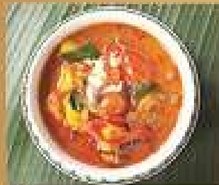
41. แกงเผ็ดเป็ดย่าง 220/330/440 Roasted duck red curry