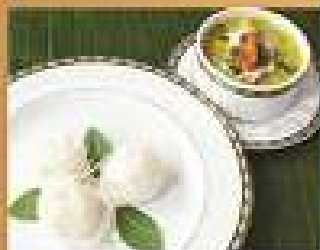
129. ขนมจีนแกงเขียวหวาน 250 ลูกชิ้นปลาทราย Fish nuggets green curry with steamed rice noodle