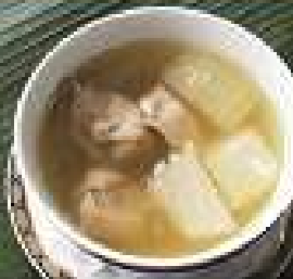
62. เป็ดต้มน้ำส้ม 220 / 330 Double boiled duck with preserved lemon soup