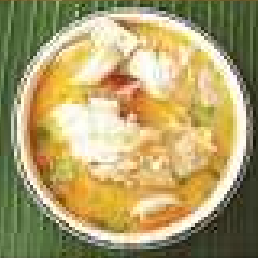
54. ต้มยำกุ้งแม่น้ำใหญ่ 550-900 ต่อ 1 ตัว Tom yum large River Prawn soup (one piece)