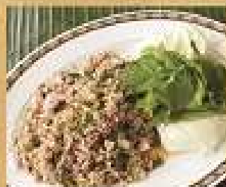
37. สามัญ/สามไก่/สามปลาช่อน 200 / 300 Spicy minced pork, chicken, or catfish salad-North-eastern style