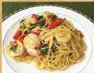
141. สปาเก็ตตี้ผัดขี้เมา 260

Stir-fried spaghetti in yellow curry powder with shrimps