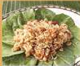
146. ส้มตำโรย Spicy lemongrass salad