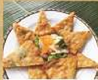
10. กระเบื้องทะเล 220 / 330 Shrimp, crab, and cashew nuts crispy pancakes