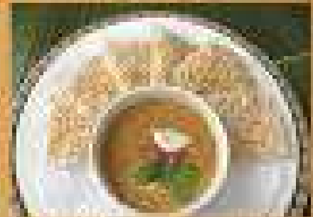
อาหารยอดนิยม Moo Joo (fried dumplings) with dipping sauce 149