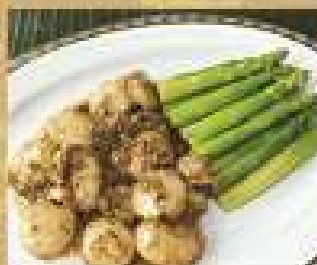
117. หอยเชลล์ เจียวน้ำนึ่งหอย 500 / 750 Stir-fried scallops with oyster sauce