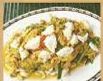
122. เนื้อปูผัดผงกะหรี่ 800 Stir-fried crab meat with curry powder