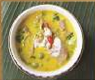
40. แกงเขียวหวานเนื้อ 280/420/560 Beef green curry แกงเขียวหวาน ไก่/หมู 200/300/400 Chicken or pork green curry