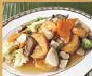
150. เต้าหู้ Tofu and ingredients in Chinese brown sauce