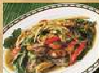
76. ผัดฝาหมึกน้ำจิ้ม 200 / 300 Stir-fried mussels with kaempfer and chili