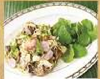
35. ยำหอยแครง 200 / 300 Spicy cockles salad with shredded lemon grass and mints