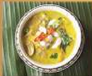
153. แกงเขียวหวาน Vegetarian green curry