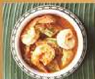
46. แกงส้มกุ้ง ซดลรสเปรี้ยว Acacia omelette in spicy tamarind soup with shrimps