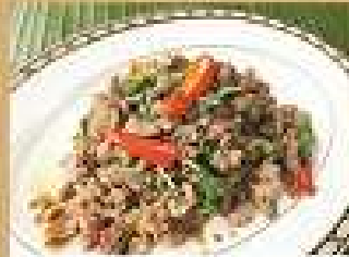
68. ผักกะเพราหมู/ไก่ 220 / 330 Stir-fried minced pork or chicken with holy basil and chili ผัดกะเพราเนื้อ 280 / 420 Stir-fried beef with holy basil and chili