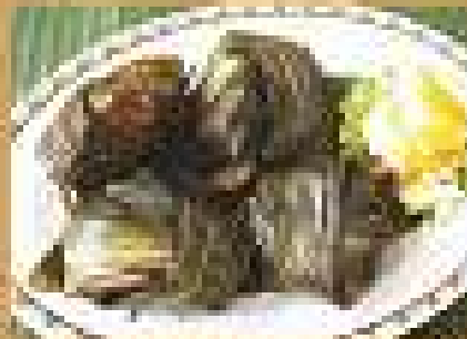
อาหารยอดนิยม Deep Fried Chicken wrapped in potato skins 149