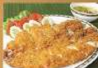
110. ปลาช่อน 490-540 ทอดเคลือบเนย Deep-fried Butter fish with spicy and sour mango dip