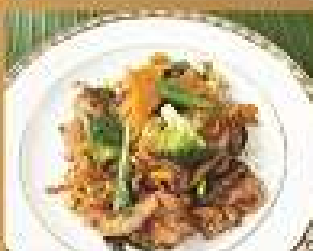
127. ก๋วยเตี๋ยวผัดซีอิ๊วหมู/ไก่ 190 Stir-fried rice noodle with pork or chicken