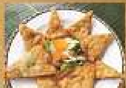
อาหารยอดนิยม Fried Pork with dumplings and green vegetables 149