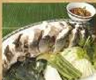
36. ปลาช่อนนึ่งพริก 390 / 450 Steamed Snake-head fish with spicy dip