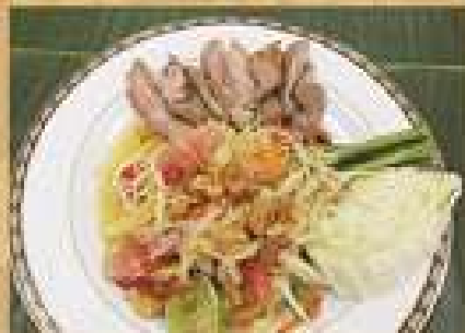
ส้มตำหมูย่าง Spicy papaya salad with grilled pork 220 / 330