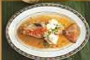
98. กุ้งแม่น้ำไฉ่ฉง 550-900 นึ่งสมุนไพร 1 ตัว Steamed large River Prawn with garlic and lime sauce กุ้งขนาดกลาง 1 ตัว 240-260 Steamed River Prawn with garlic and lime sauce