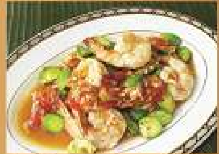
คะน้าผัดกุ้ง 280 / 420 Stir-fried satoy beans, spicy shrimp paste with shrimp