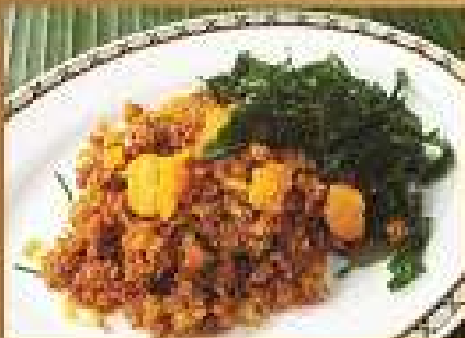
ปลานึ่งฟูผัดกระเทียม 200 / 300 Stir-fried fluffy Catfish with chili