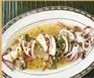
112. ปลาหมึกไถ้มะนาว 220 Steamed squid with lime and chili