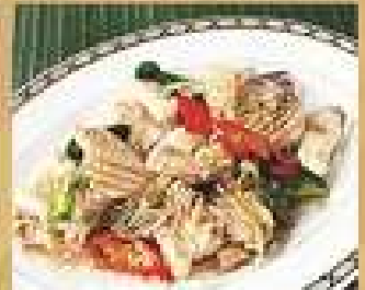
114. ปลาหมึกผัดขี้กุ้ง 240 / 360 Stir-fried squid with shrimp paste sauce