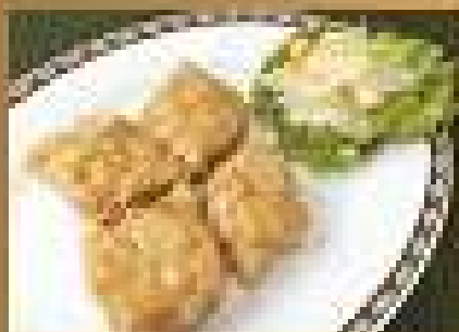
อาหารยอดนิยม B Deep Fried Pork Meatballs with green vegetables 149