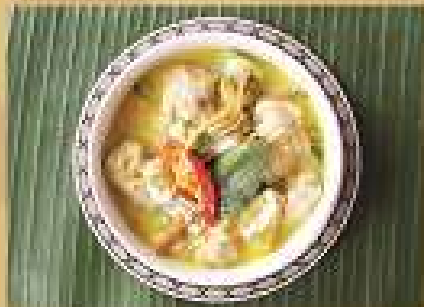
แกงเขียวหวาน ลูกชิ้นปลาทอด Fish nuggets green curry 220 / 330 / 440