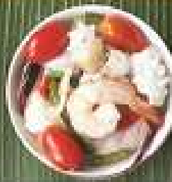
56. ต้มยำรวมมิตร 260 / 390 / 520 ทะเลน้ำใส Clear Tom yum seafood