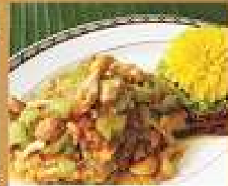
147. ส้มตำ Spicy bitter gourd or wing bean salad