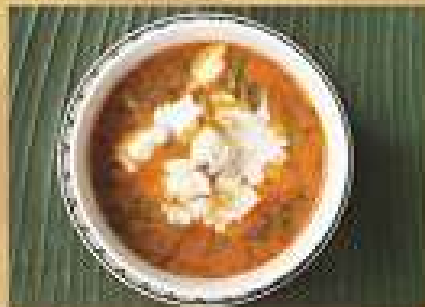
แกงหัวตะกั่วต้มยำ Crab meat and scoria red curry 300 / 450 / 600