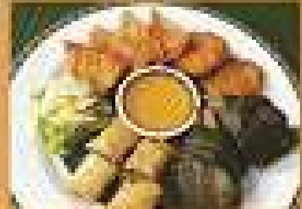
อาหารยอดนิยม B Mixed Appetizer B 149