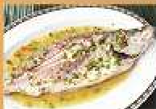
109. ปลากระพง 490-540 นึ่งสมุนไพร Steamed Sea Bass with garlic and lime