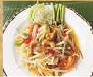
34. ส้มตำปู 200 / 300 Spicy papaya salad with shrimps