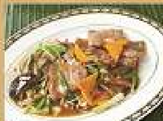
80. เนื้อผัดน้ำจิ้มหอย 280 / 420 Stir-fried beef with oyster sauce