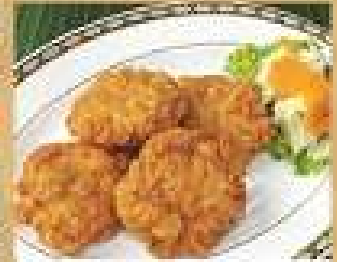
12. ทอดมันกุ้ง 220 Deep fried shrimpcakes