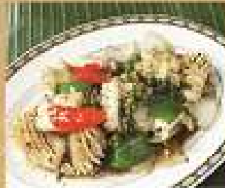
113. ปลาหมึกผัดพริกไทยดำ 240 / 330 Stir-fried squid with black pepper