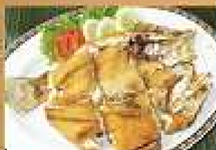
108. ปลากระพงทอด 490-540 จาน้ำปลา Deep-fried Sea Bass with fish sauce