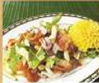
29. ยำสามเกลอ 200 / 300 Spicy dried pork, fish maw, and cashew nuts salad