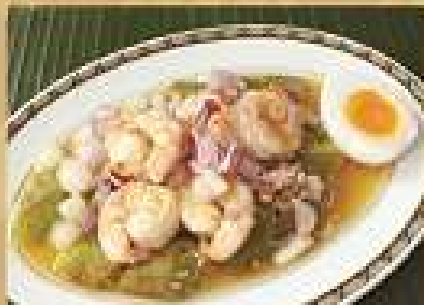
ส้มตำเขียดขาว Spicy grilled Thai egg plants salad with shrimps 200 / 300