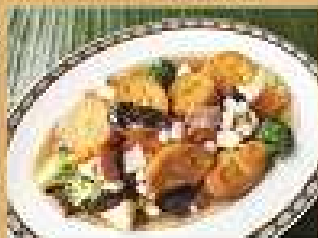
78. เต้าหู้ทรงเตี๋ย 200 / 300 Tofu, ham, and vegetables in brown sauce