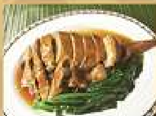
73. เป็ดพะโล้ครึ่งตัว 420 (ครึ่งตัว) Seamed half duck in Chinese brown sauce