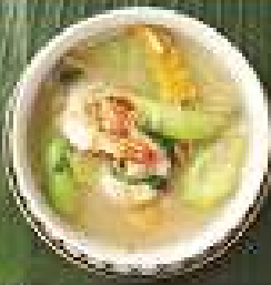
60. แกงจืดรวมมิตร 220 / 330 / 440 Mixed vegetables, lemon basil, and kaempfer soup with shrimps