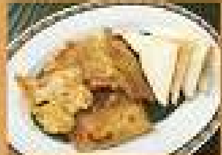
อาหารยอดนิยม Fried Pork 149