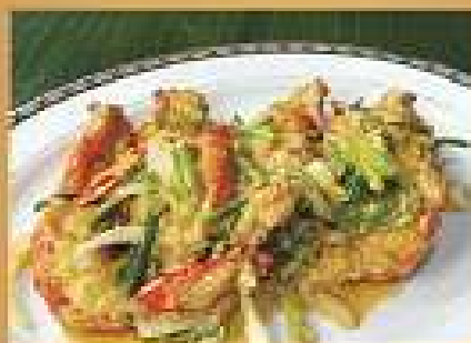
กุ้งแม่น้ำผัดผงกระเทียม 2 ตัว 480 - 520 Stir-fried River Prawn with curry powder