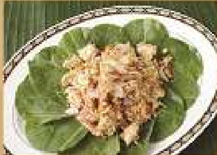
ส้มตำโรย Spicy lemongrass salad 200 / 300