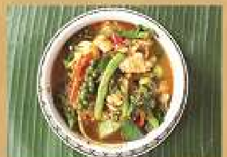
แกงเผ็ด ลูกชิ้นปลาทอด/หอยคั่ว Fish nuggets or minced shrimps Thai country curry 220 / 330 / 440