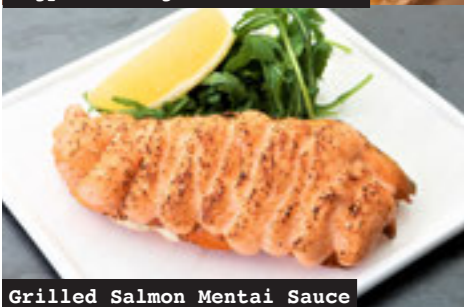
Grilled Salmon Mentai Sauce