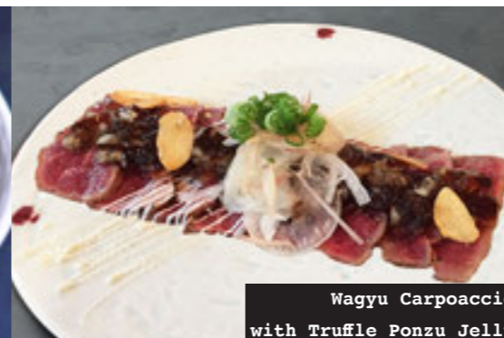
Wagyu Carpaccio with Truffle Ponzu Jelly