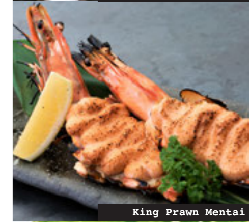
King Prawn Mentai