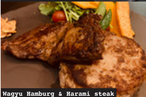
Wagyu Hamburg & Harami steak