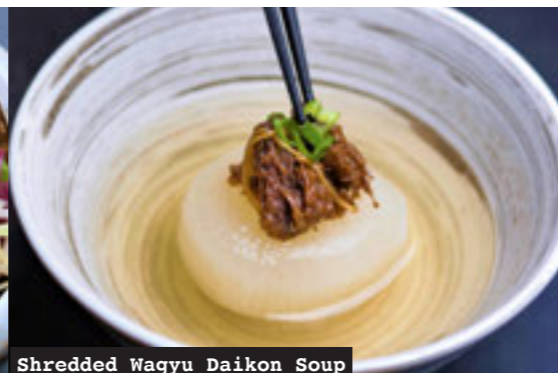
Shredded Wagyu Daikon Soup