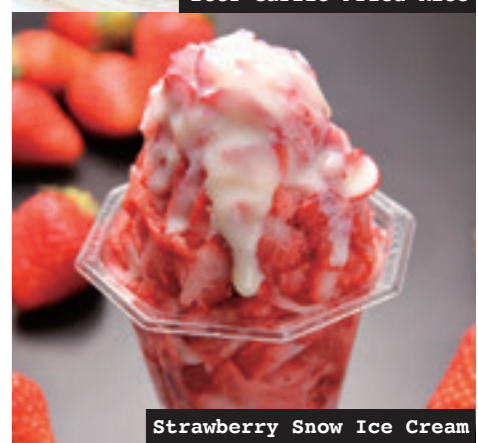
Strawberry Snow Ice Cream