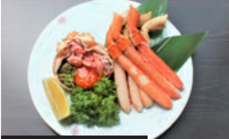
Snow Crab Plate