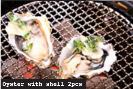
Oyster with shell 2pcs