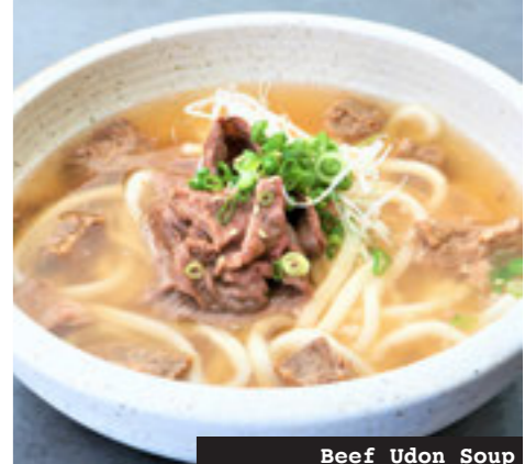
Beef Udon Soup