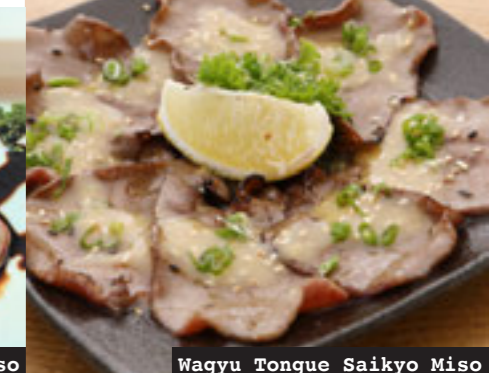
Wagyu Tongue Saikyo Miso