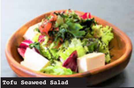
Tofu Seaweed Salad