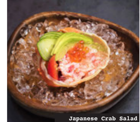
Japanese Crab Salad