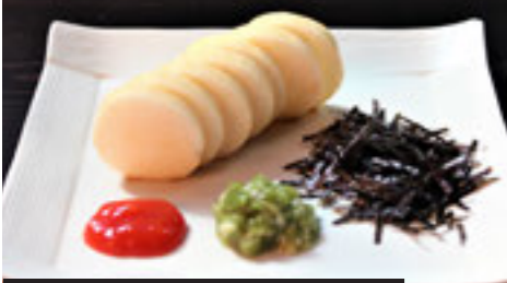
Mountain Yam with Plum Sauce