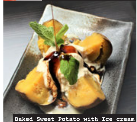
Baked Sweet Potato with Ice cream