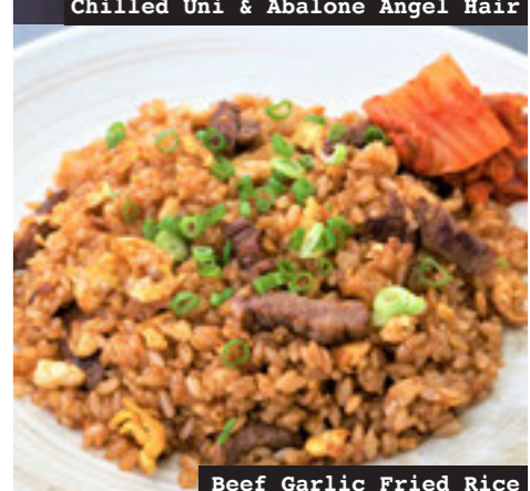
Beef Garlic Fried Rice