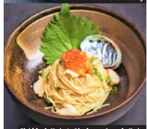
Chilled Uni & Abalone Angel Hair