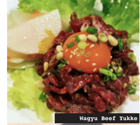
Wagyu Beef Yukke