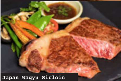
Japan Wagyu Sirloin