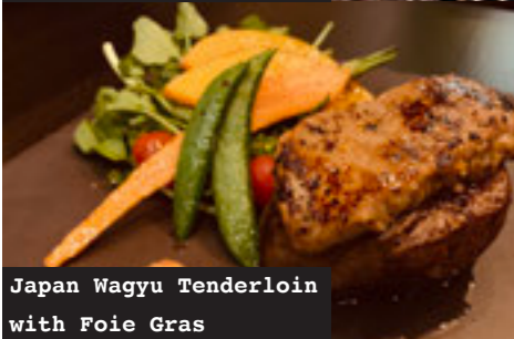
Japan Wagyu Tenderloin with Foie Gras