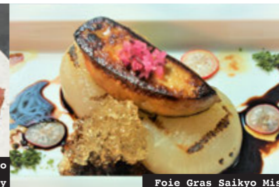
Foie Gras Saikyo Miso