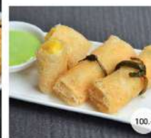
36. ปอเปี๊ยะมะม่วงไส้มังงะทอด DEEP FRIED CRISPY SPRING ROLLS WITH SHRIMP AND MANGO