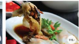
27. ก๋วยเตี๋ยวหลอดฮ่องกงหมูแดง STEAMED BBQ PORK ROLLED WITH RICE NOODLE HONG KONG STYLE