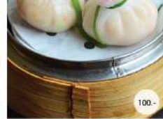
10. ดงเงินดงทองน้ำมันเห็ดทรัฟเฟิล STEAMED SHRIMP DUMPLING WITH TRUFFLE OIL FLAVOR