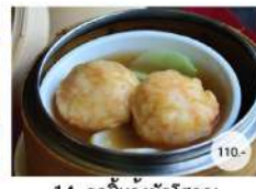
14. ลูกชิ้นกุ้งผักโสภณ STEAMED SHRIMP BALLS WITH VEGETABLE IN BROWN SAUCE