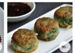
31. กุ้งช่วยทอด DEEP FRIED CHINESE CELERY WITH SHRIMP