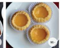
38. ตำนทาร์ท SWEET EGG TART