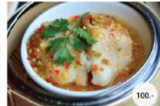
17. เนื้อปลาฝิ่งพริกมะนาว STEAMED FILLET FISH WITH CHILI LEMON SAUCE