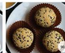
30. ข้าวเหนียววงทอด DEEP FRIED SWEET STICKY RICE WITH SESAME