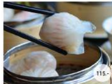
6. ซะเก๋า STEAMED PRAWN DUMPLING