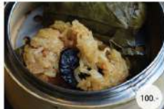
18. ข้าวเหนียวห่อใบบัว STEAMED STICKY RICE IN LOTUS LEAF