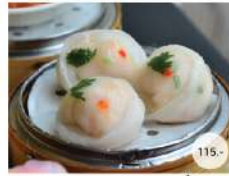
3. ขนมจีบหอยเชลล์ STEAMED SHRIMP DUMPLING TOPPED SCALLOP