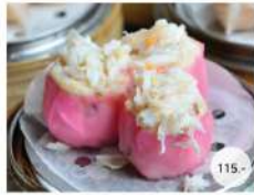
2. ขนมจีบปู STEAMED SHRIMP AND CRAB MEAT DUMPLING