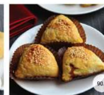
37. พายหมูแดง BAKED BBQ PORK PASTRIES