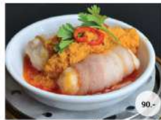
12. หมูเบคอนนึ่งซอสไข่เค็ม STEAMED BACON WITH MINCED SHRIMP IN SALTED EGG SAUCE