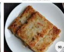
32. ขนมผักกาดทอด DEEP FRIED TURNIP WITH MINCED SHRIMP