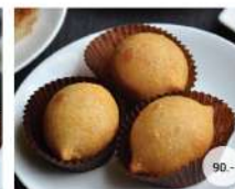
29. ซัมสุบง DEEP FRIED CHICKEN AND PORK WRAPPED IN GLUTINOUS RICE FLOUR