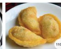
33. ผัสดก้วยทอด DEEP FRIED SHRIMP DUMPLING PUI KOH