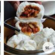
21. ซาลาเปาไส้หมูแดง STEAMED BIG PORK BUNS