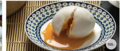
23. ซาลาเปาไส้ลาวาไข่เค็ม STEAMED MELTED CUSTARD SALTED EGG BUNS