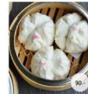
24. ซาลาเปาไส้หมูสับ STEAMED MINCED PORK BUNS