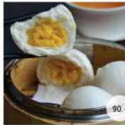
22. ซาลาเปาไส้ครีม STEAMED CUSTARD PASTE BUNS