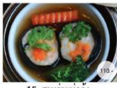
15. สาหร่ายห่อกุ้ง STEAMED MINCED SHRIMP WRAPPED SEAWED IN BROWN SAUCE