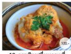
13. กรรเชียงปูฝิ่งผงกระหรี่ STEAMED CRAB LEGS WRAPPED WITH MINCED SHRIMP IN YELLOW CURRY SAUCE