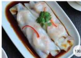
26. ก๋วยเตี๋ยวหลอดฮ่องกง STEAMED PRAWN ROLLED WITH RICE NOODLE HONG KONG STYLE