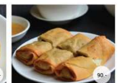
34. ปอเปี๊ยะทอด DEEP FRIED CRISPY SPRING ROLLS