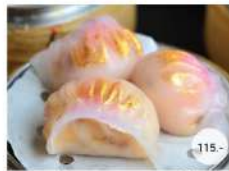
9. ซะเก๋าทองคำซอสเอ๊กซโ GOLDEN DUMPLING WRAPPED WITH SHRIMP XO SAUCE