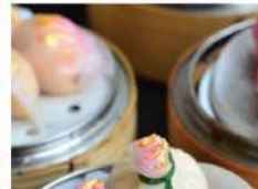
7. ผัสดก้วยเล้ง STEAMED SHRIMP AND CHINESE SPINACH DUMPLING