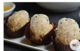
28. เผือกทอด DEEP FRIED MINCED TARO