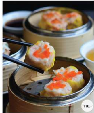
1. ขนมจีบ STEAMED MINCED PORK AND SHRIMP DUMPLING