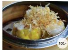
5. ขนมจีบคัตโด้ STEAMED PORK AND SHRIMP DUMPLING TOPPED KATSUDO