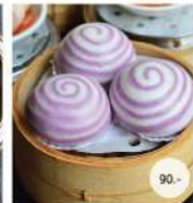
25. ซาลาเปาไส้สวามันม่วง STEAMED MELTED PURPLE POTATO BUNS