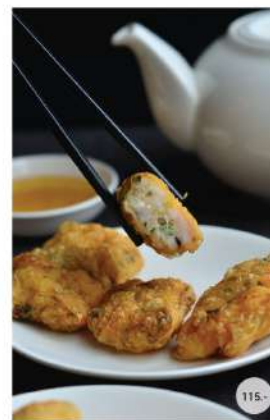
35. ฟองเต้าหู้ยัดไส้กุ้งทอด DEEP FRIED MINCED SHRIMP ROLLS WITH BEAN SHEET