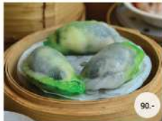
8. ซะเก๋าคุ้ง STEAMED PRAWN DUMPLING