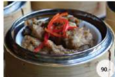
16. ซี่โครงหมูนึ่งเต้าซี่ STEAMED PORK SPARERIBS WITH BLACK BEAN SAUCE