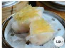
4. ขนมจีบหูฉลาม STEAMED MINCED PORK AND SHRIMP DUMPLING WITH SHARK'S FIN