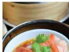
19. กุ้งสดใส่ฝิ่งพริกมะนาว STEAMED SHRIMP IN CHILI LEMON SAUCE