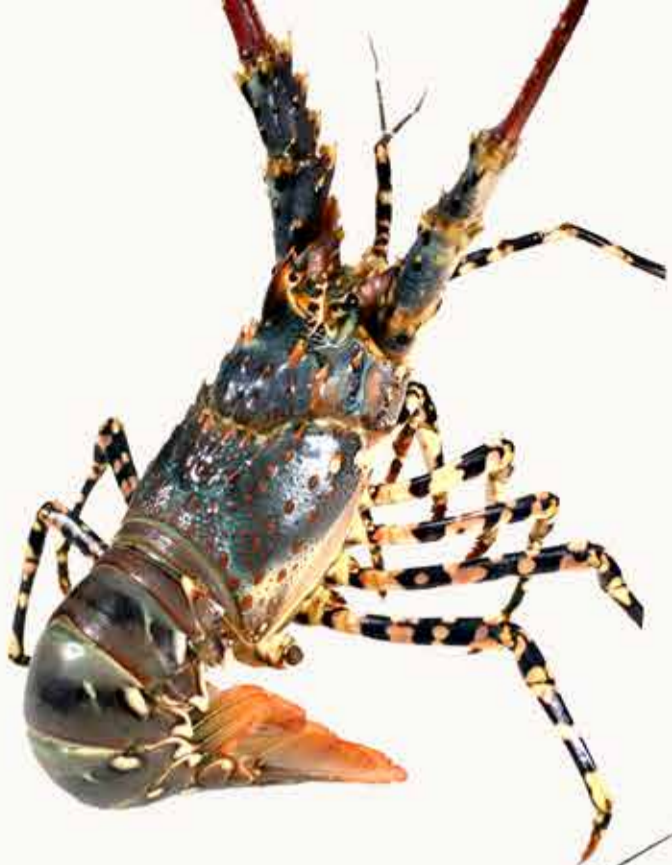
珍珠龙虾 Pearl Lobster Жемчужный Лобстер