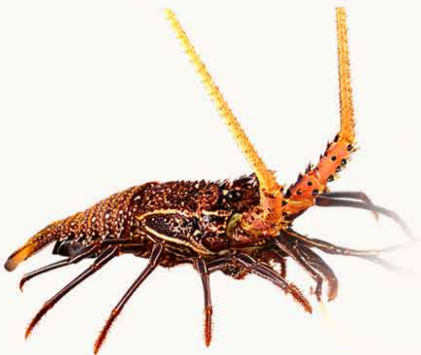
巴迪龙虾 Spotted Lobster Пятнистый Лобстер