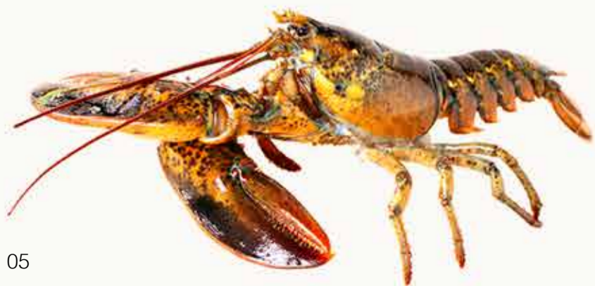
加拿大龙虾 Canadian Lobster Канадский Лобстер