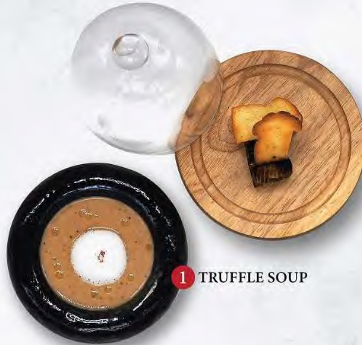
1 TRUFFLE SOUP