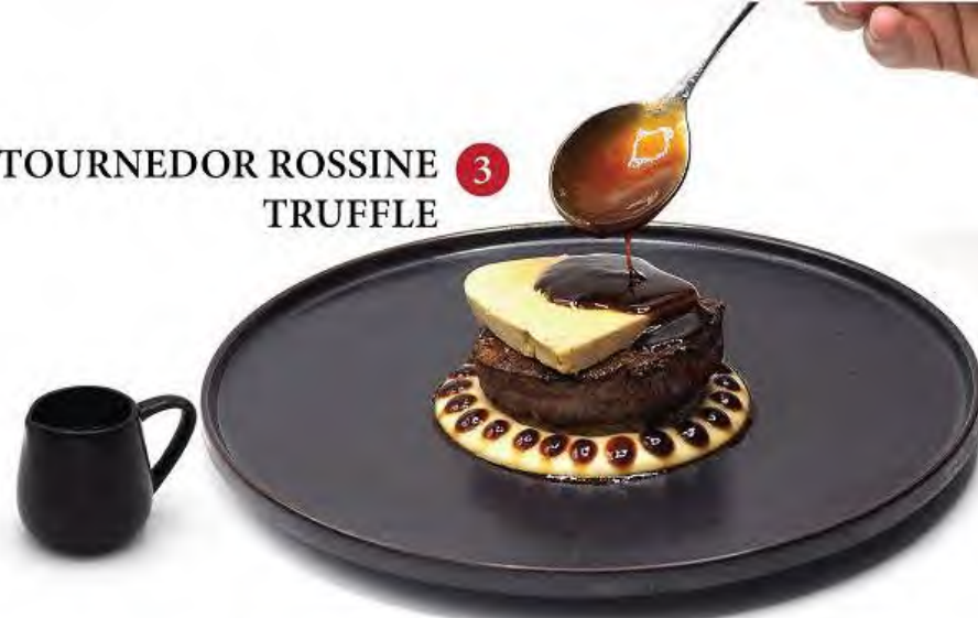
3 TOURNEDOR ROSSINE TRUFFLE