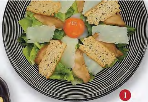
1 CHICKEN CESAR AND ONZEN EGG SALAD