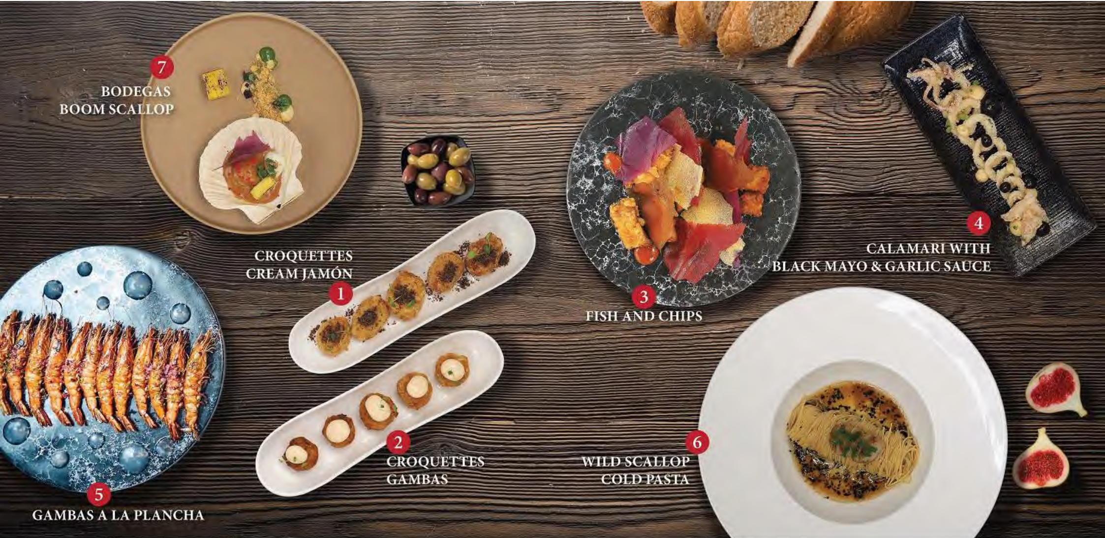
7 BODEGAS BOOM SCALLOP