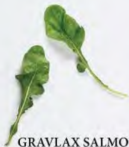
2 GRAVLAX SALMON SALAD WITH MANGO DRESSING AND TARTAR SAUCE