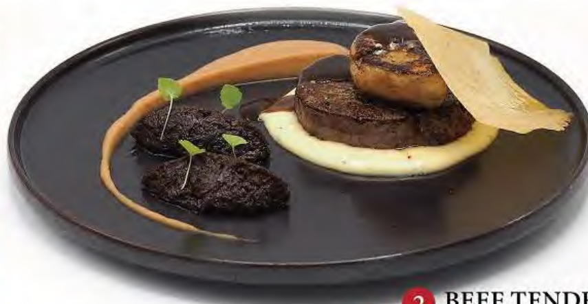
2 BEEF TENDERLOIN WITH FOIE GRAS