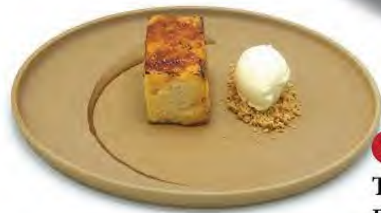
TORRIJA WITH BANANA ICE