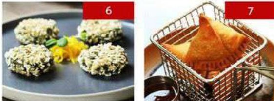
6. hara bhara kebab | 4 pcs. 290 7. vegetable samosas | 3 pcs. 160