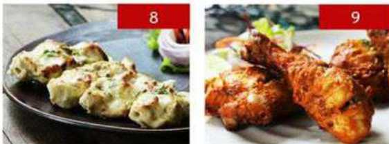
8. kebab-e-malai | 4 pcs. 390 9. tandoori chicken | 4 pcs. 390