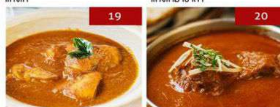
19. home-style chicken curry | 390 20. rogan josh | 550