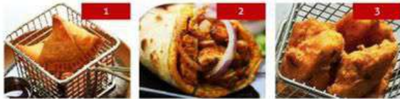
1. keema samosa | 3 pcs. 240 2. chicken kati roll | 1pc. 240 3. fish amritsari | 8 pcs. (john dory) ปลาทอด 280