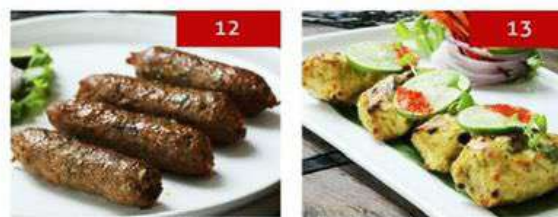
12. mutton seekh kebab | 4 pcs. 490 13. ajwaini fish tikka | 4 pcs. 490