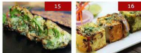
15. tandoori creamy broccoli | 4 pcs. 370 16. paneer tiranga | 3 pcs. 370