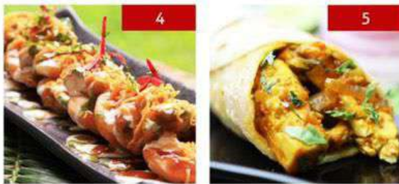
4. papdi chaat | 8 pcs. 190 5. paneer kati roll | 1pc. 240