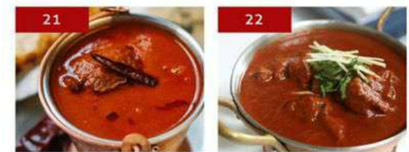
21. laal maas | 550 22. mutton vindaloo | 550