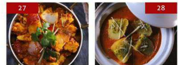
27. kadai paneer | 380 28. dum aloo banarasi | 290