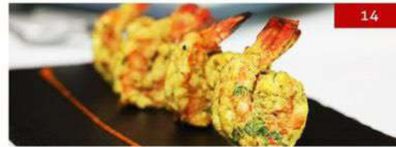
14. tandoori tiger prawns | 4 pcs. 690