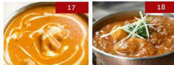
17. butter chicken | 390 18. chicken tikka masala | 390