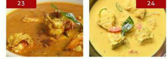
23. malabar prawn curry | 550 24. malabar fish curry | 550