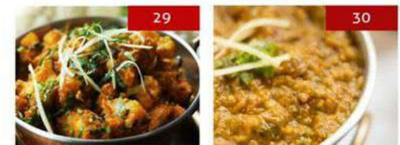
29. aloo gobhi adraki | 290 30. baingan bhartha | 290