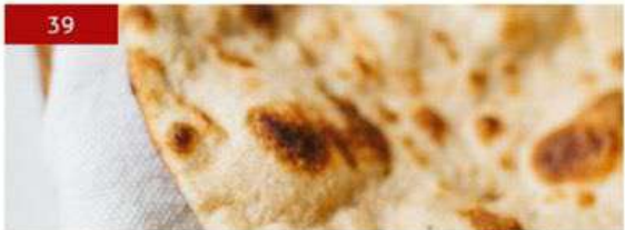
39. tandoori roti โธดีโอควัด