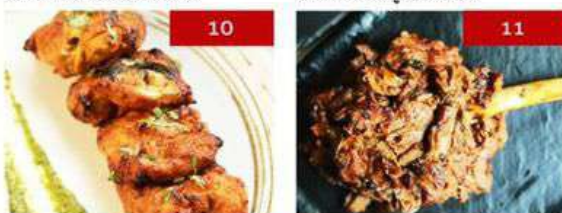
10. chicken tikka | 4 pcs. 390 11. raan | 150g 500/300g 990/500g 1690