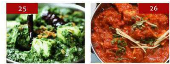
25. palak paneer | 380 26. paneer butter masala | 380