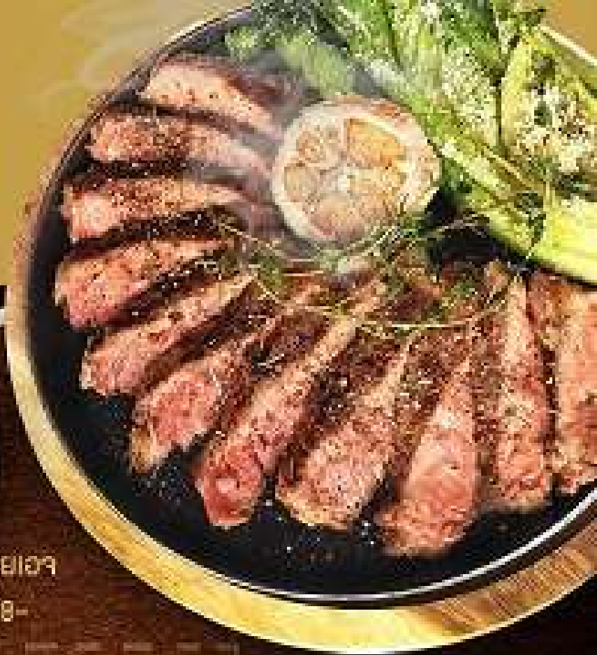
สเต็กเนื้อลืออกหน้าตู้