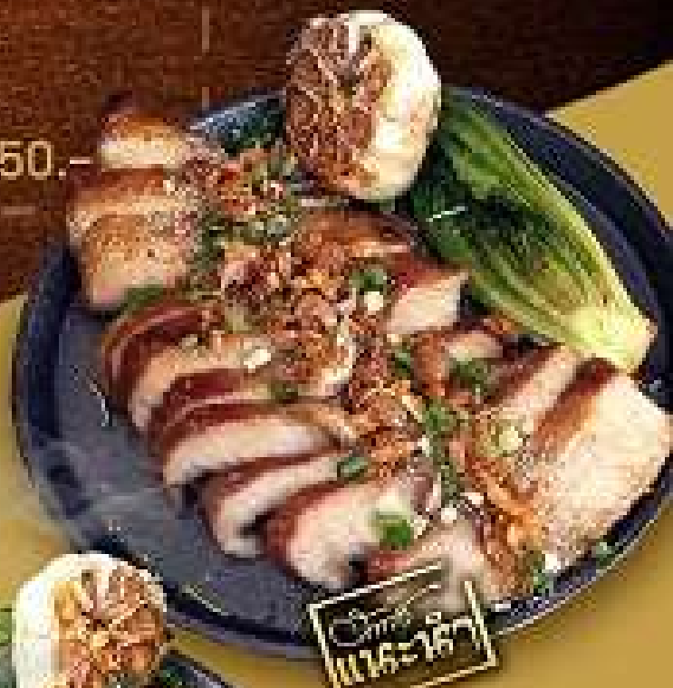
คอหมูย่าง 188.-