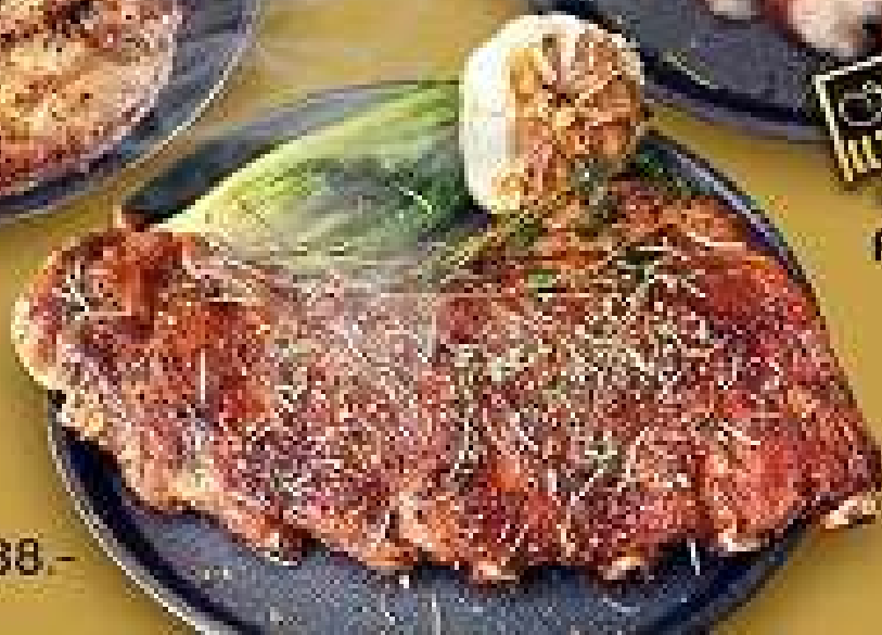
ซี่โครงหมู BBQ 288.-