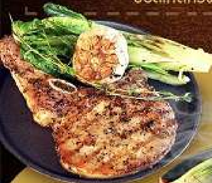
พอร์คชอป 188.-