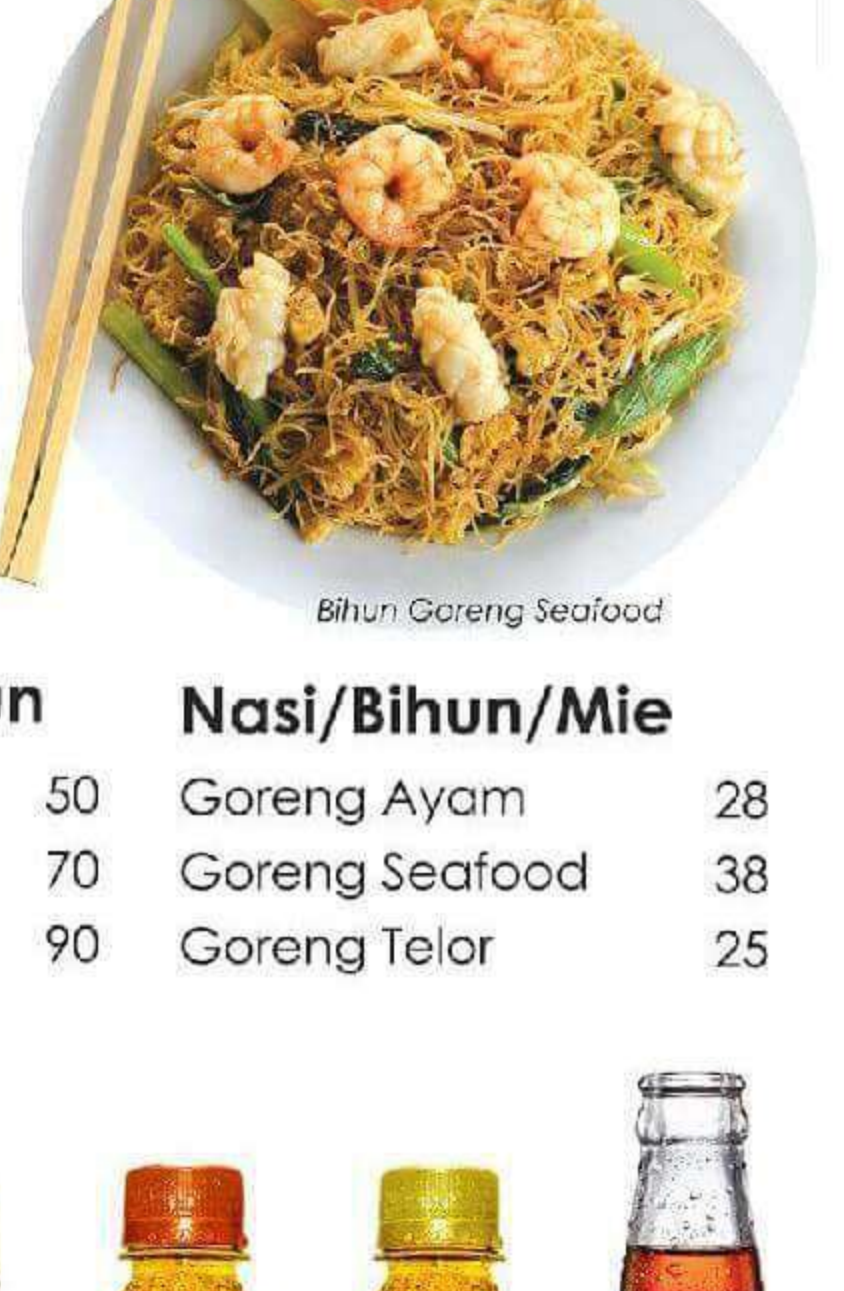
Bihun Goreng Seafood