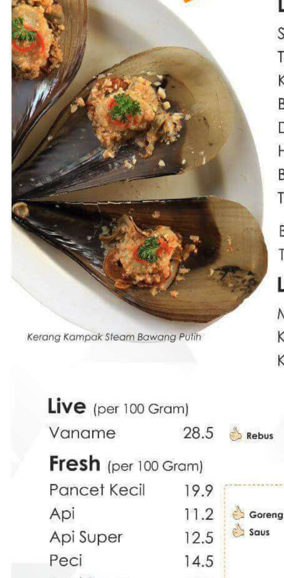
Kerang Kampak Steam Bawang Putih