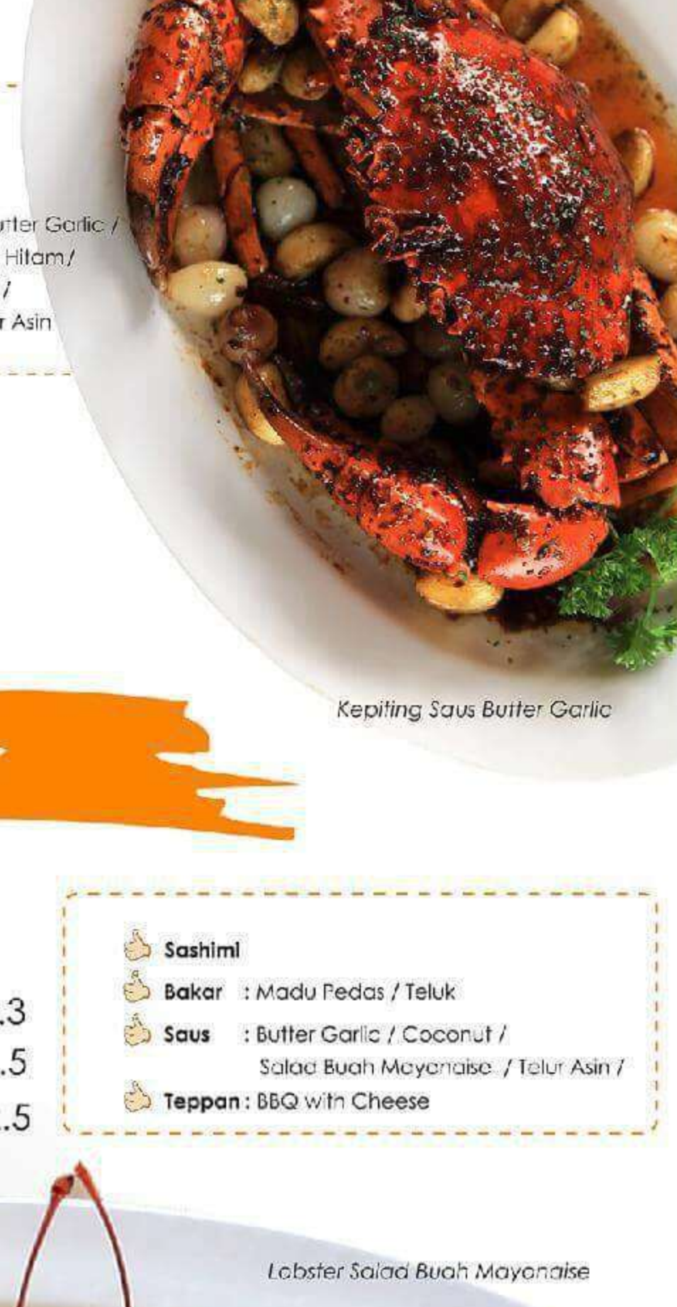
Kepiting Saus Butter Garlic