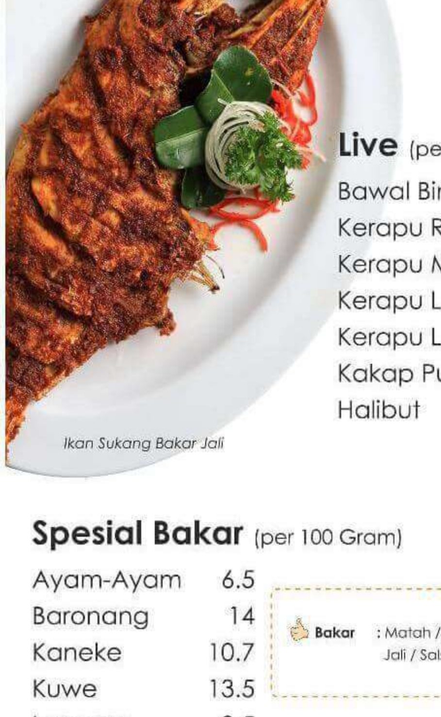
Ikan Sukang Bakar Jali