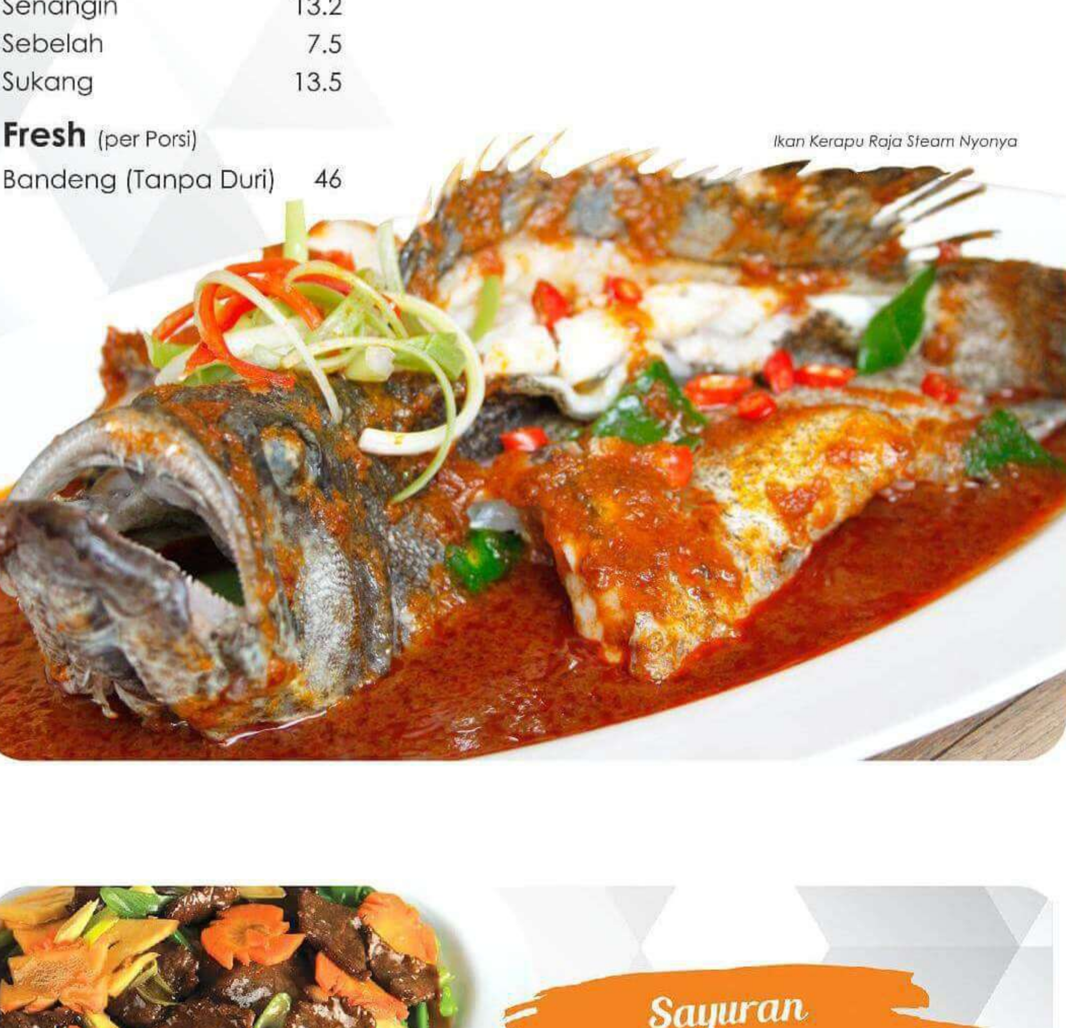
Ikan Kerapu Raja Steam Nyonya