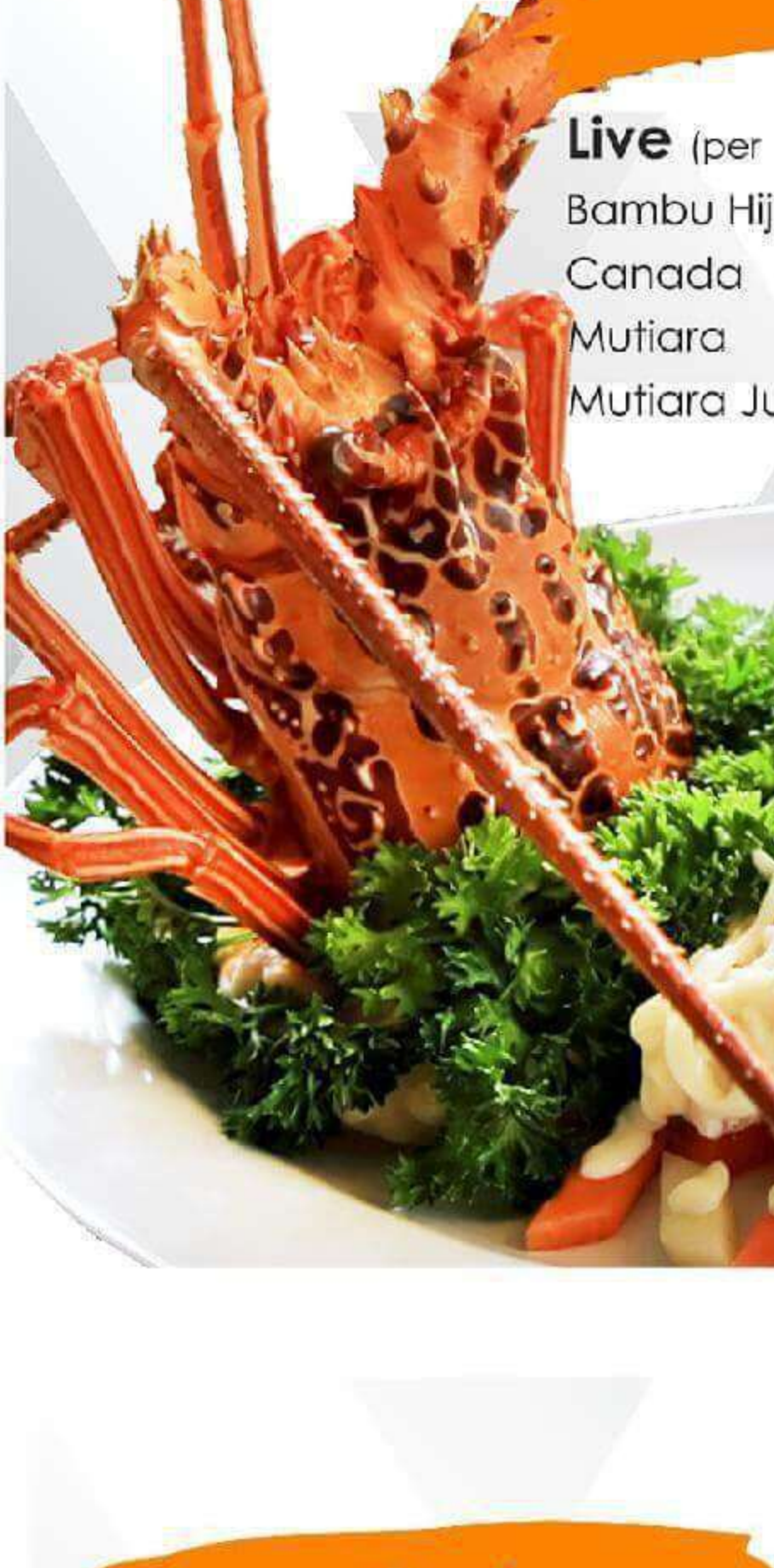
Lobster Salad Buah Mayonaise