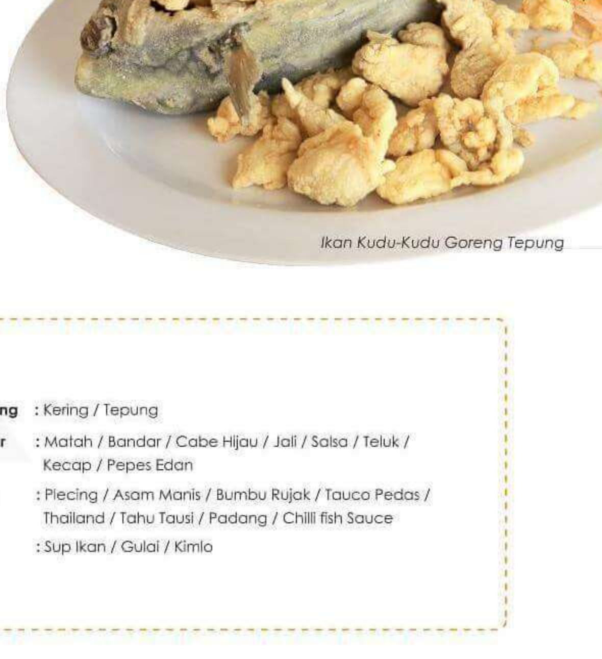
Ikan Kudu-Kudu Goreng Tepung