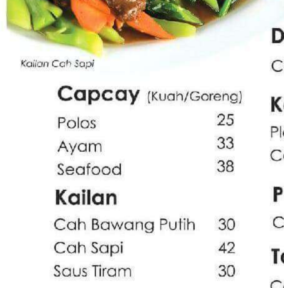
Kailan Cah Sapi