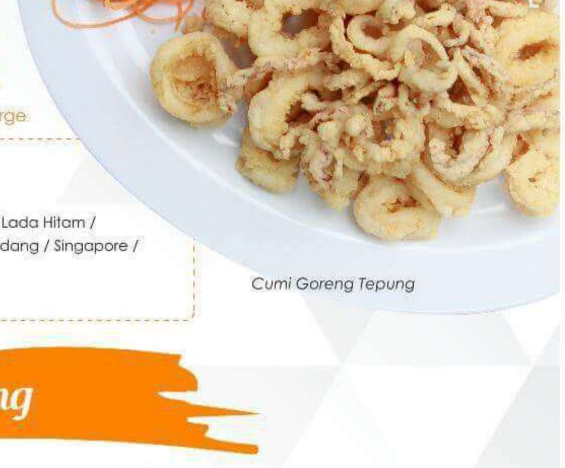
Cumi Goreng Tepung