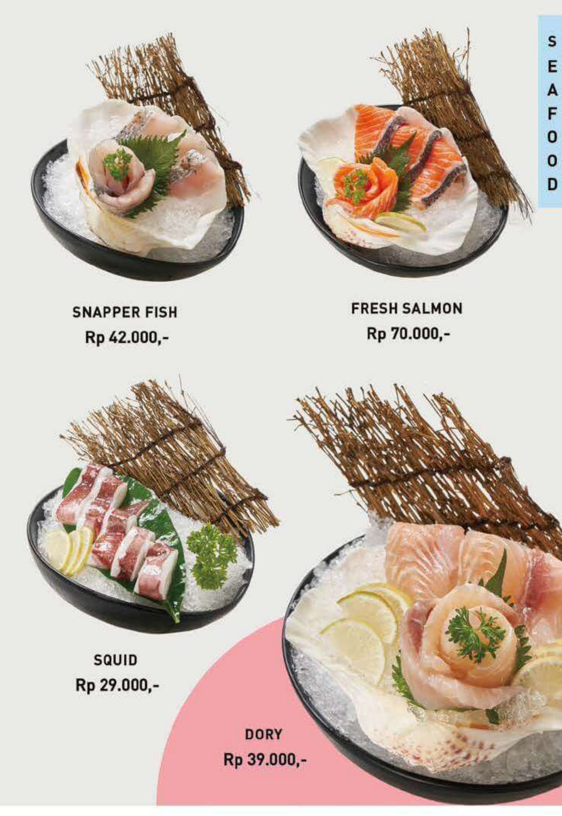
SNAPPER FISH Rp 42.000,-