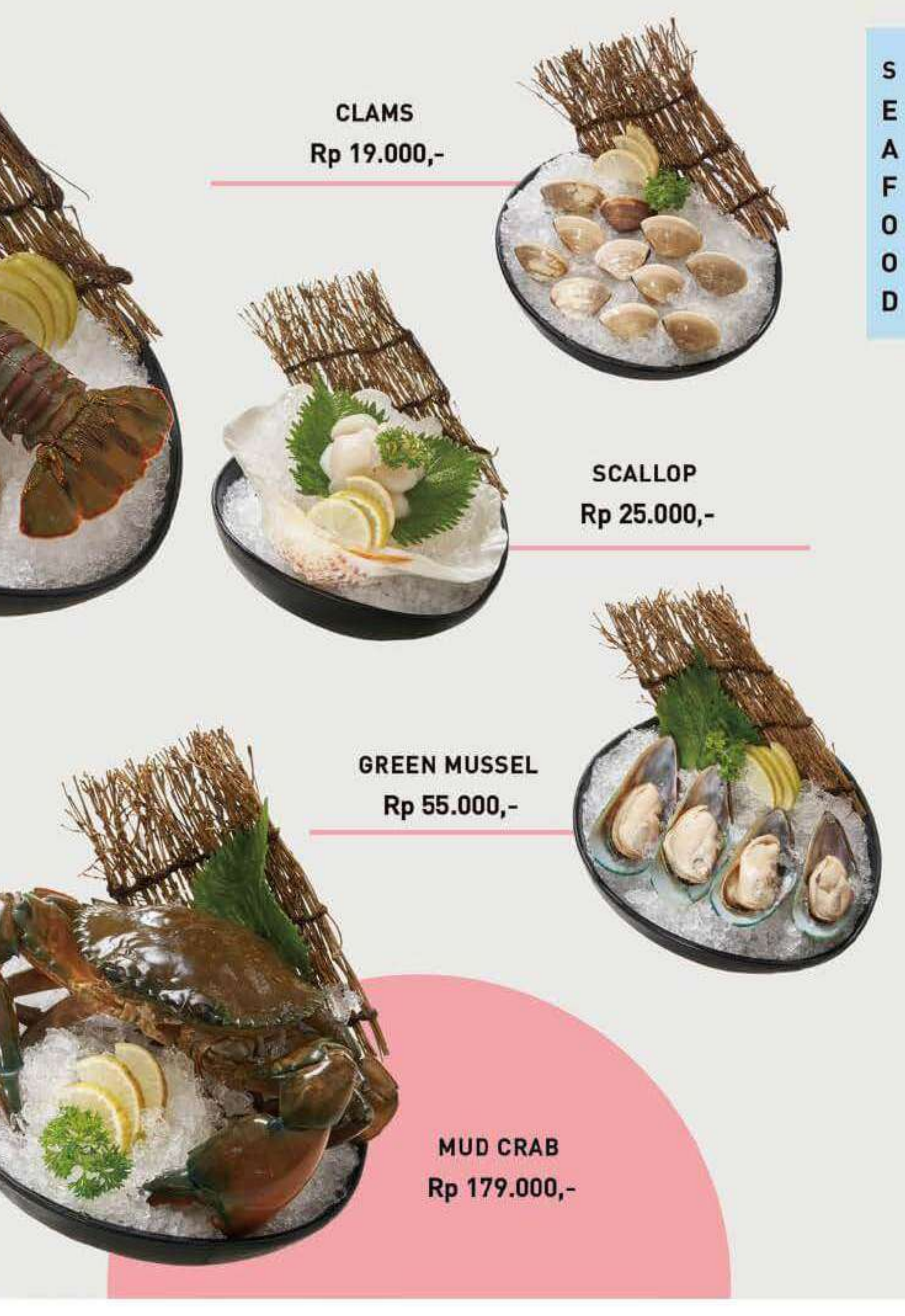
CLAMS Rp 19.000,-