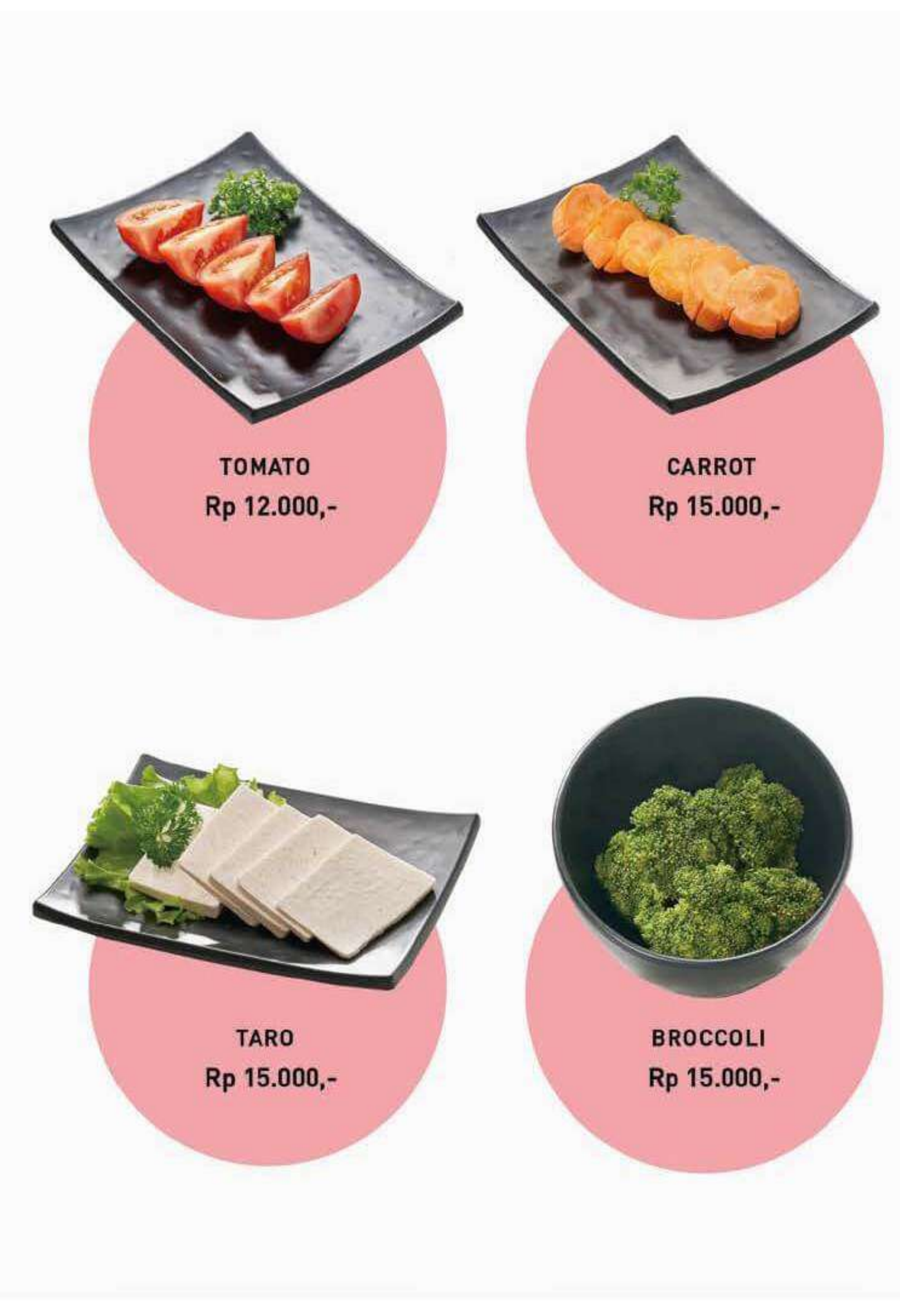
TOMATO Rp 12.000,-