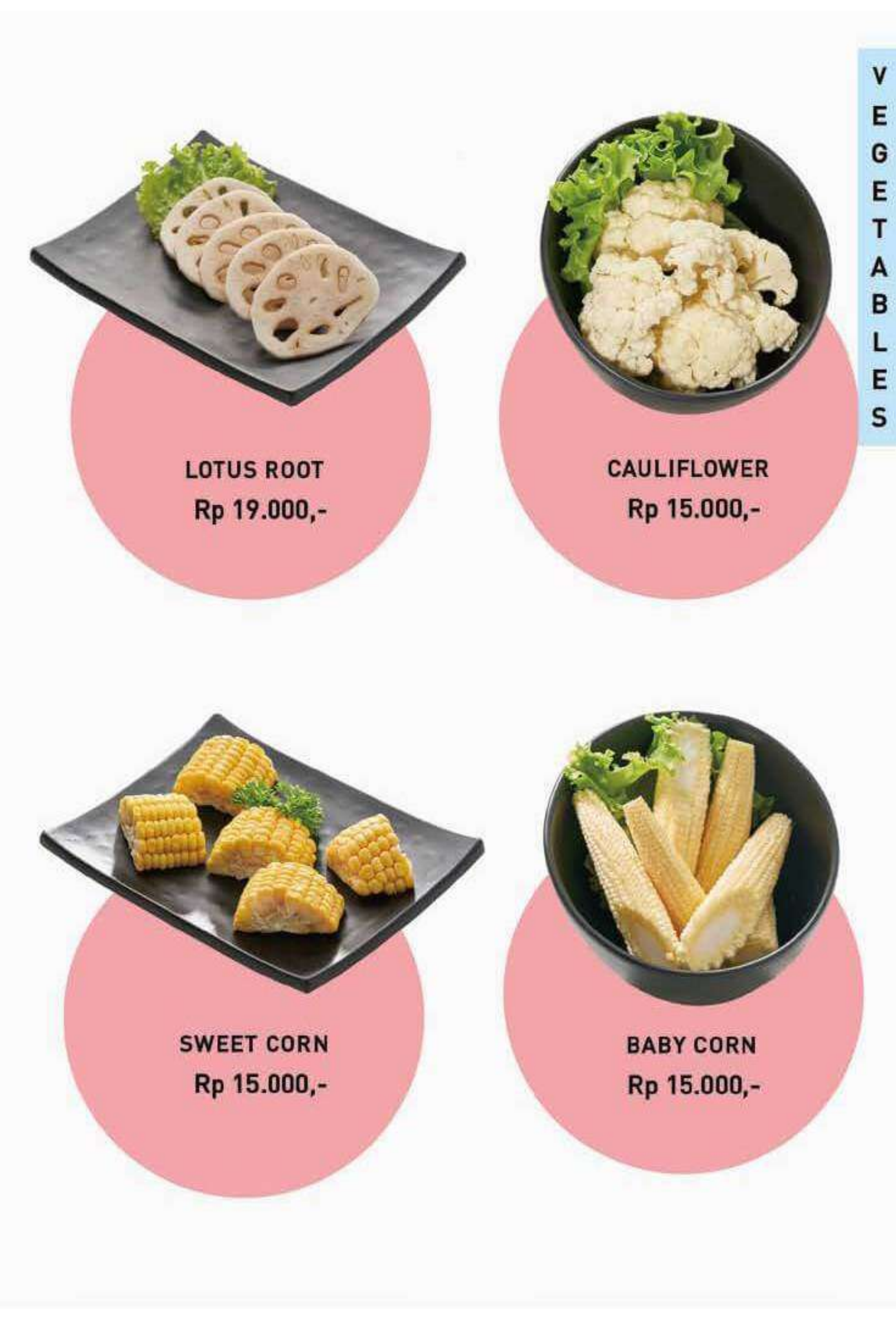
LOTUS ROOT Rp 19.000,-