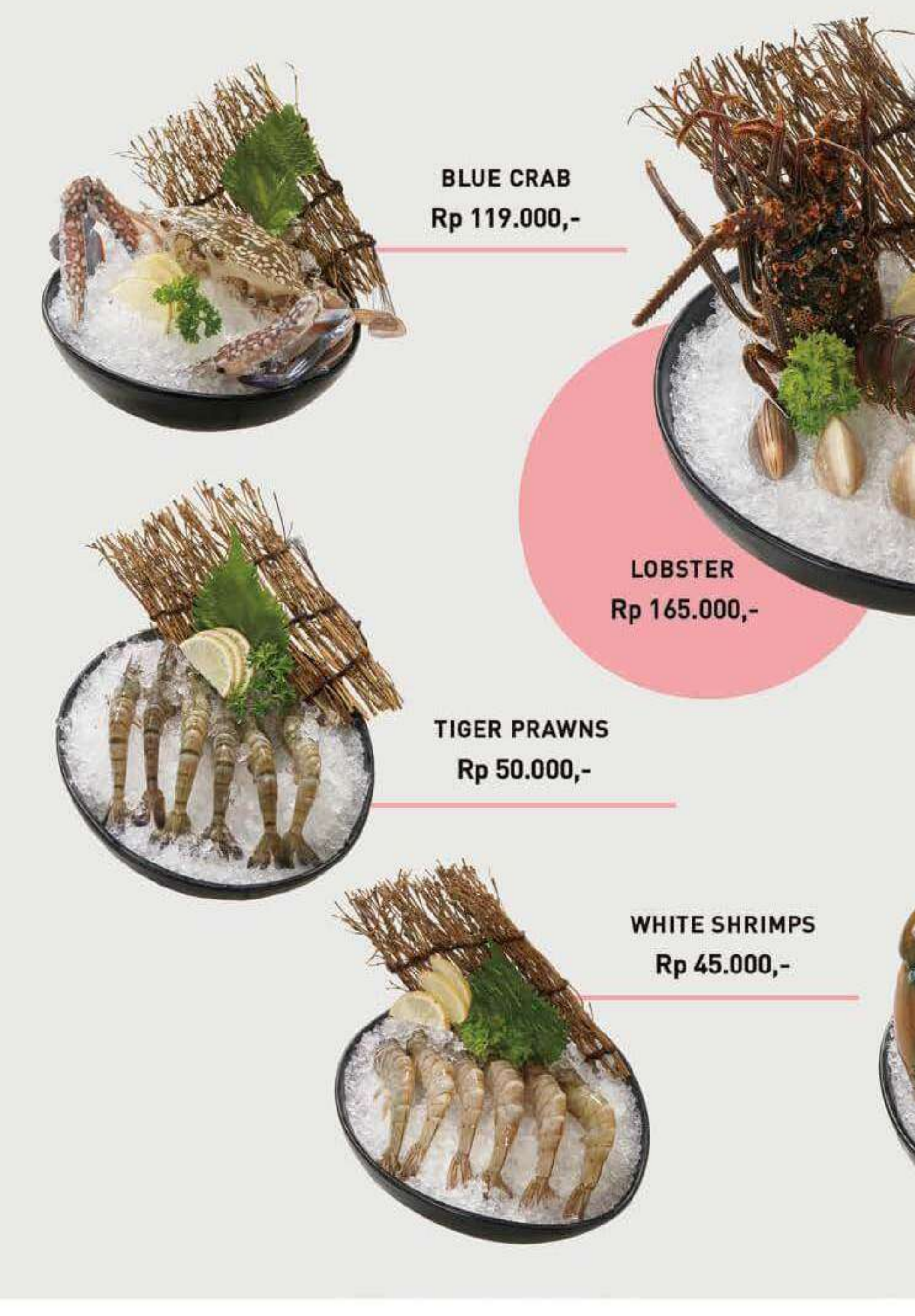
BLUE CRAB Rp 119.000,-